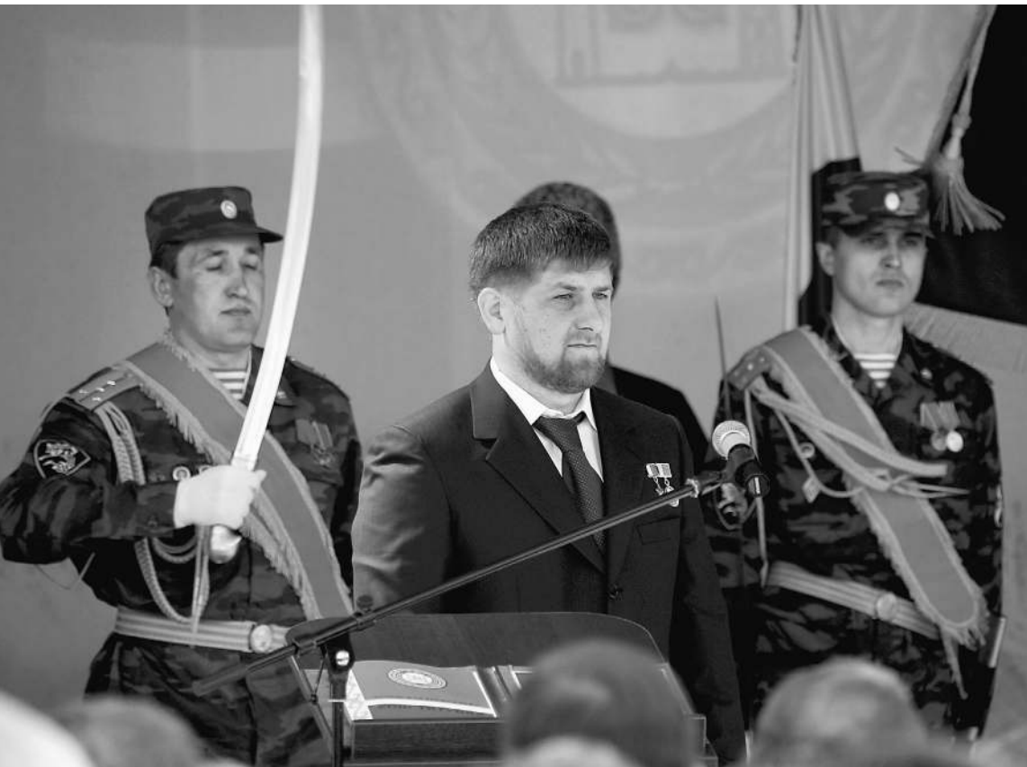
Гудермес. 5 апреля 2007 года. Новый президент Чечни Рамзан Кадыров

Вчера на окраине Гудермеса в правительственной резиденции вступил в должность президента Чеченской Республики Рамзан Кадыров. В России впервые появился глава региона, которому недавно исполнилось 30 лет. Республика готовилась к инаугурации в авральном режиме. О том, как это было, из Чечни передает специальный корреспондент «Известий» Юрий Снегирев .