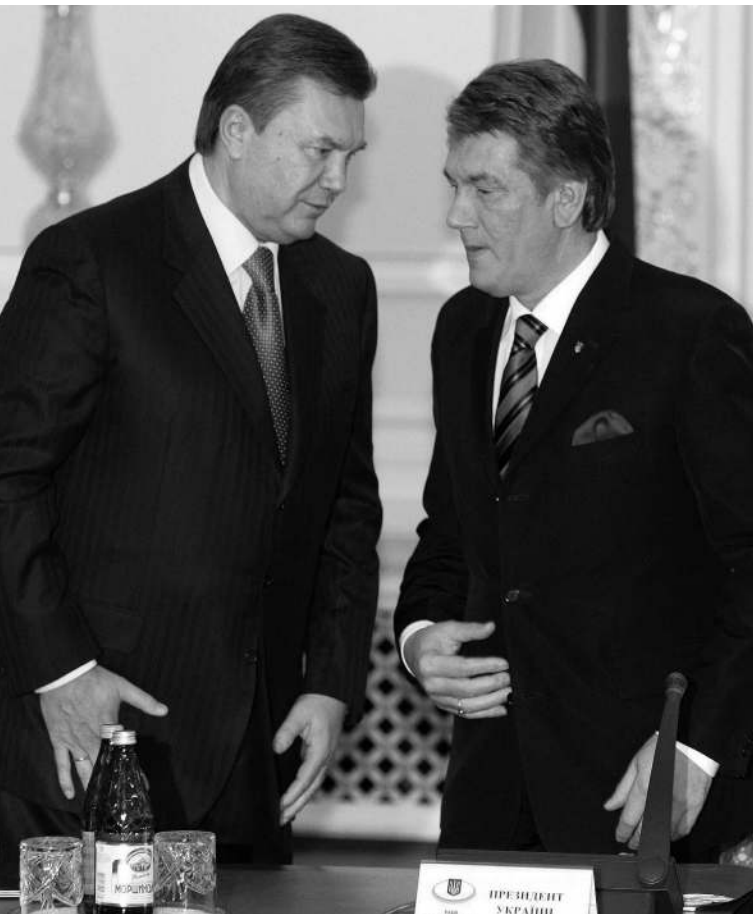
На заседании СНБО два Виктора вели диалог глухих

Разговор явно не получился. Янукович и несколько его сторонников демонстративно покинули заседание. Лидеры Партии регионов вновь обвинили президента в «узурпации власти». Ющенко же впервые с начала кризиса не исключил «силовой вариант». В интервью британской газете «Гардиан» он заявил: действия Януковича могут привести к тому, что в Киеве повторится московский сценарий 1993 года, когда президент и парламент выясняли отношения при помощи танков. → стр. 4