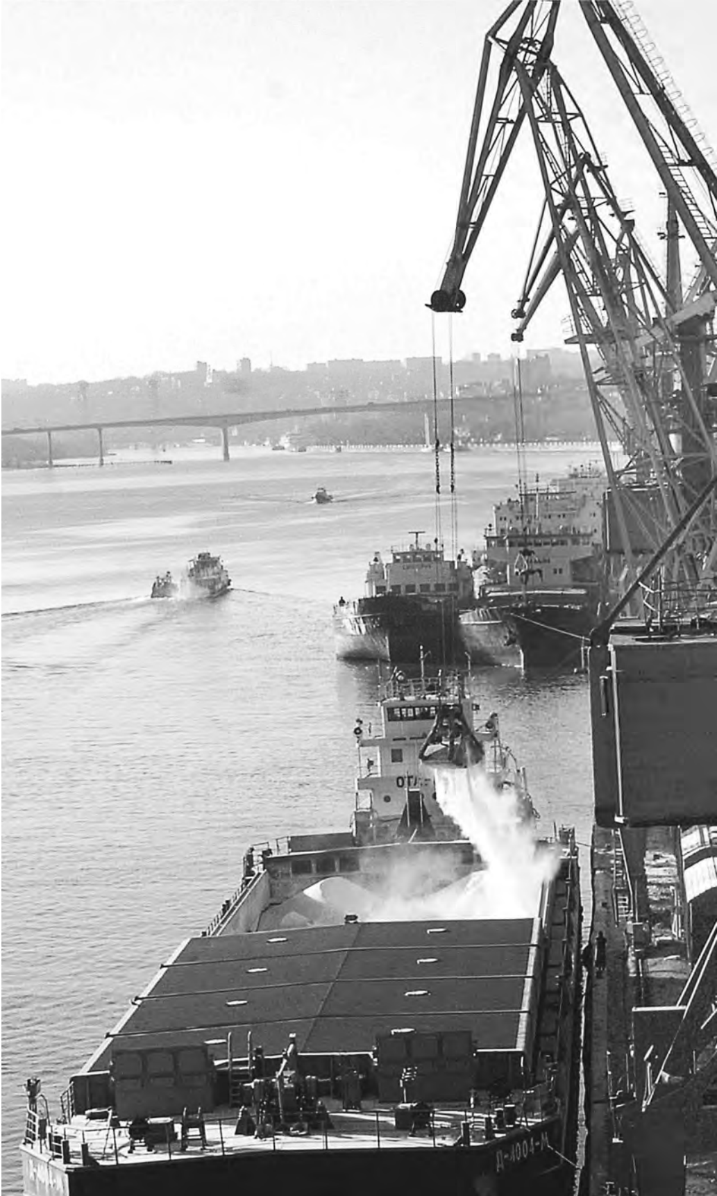
В условиях маловодности Росморречфлот вынужден вводить ограничения на водохозяйственную деятельность в бассейне Дона, в том числе на движение водного транспорта.

В этом году меняющийся климат уже продемонстрировал свое влияние на судоходство. Беснежная зима привела к тому, что скорость потока на входе в Цимлянское водохранилище в середине апреля оказалась минимальной за всю историю его эксплуатации, 552 кубических метра в секунду. Реки остались на грунтовом питании, а полноводность Дона на 70 процентов обеспечивает тающий севернее снег. Учитывая сложившуюся ситуацию, Росморречфлот ввел ограничения на водохозяйственную деятельность в бассейне Дона, в том числе на движение водного транспорта. Ширина судового хода на девяти перекатах в Азово-Донском бассейне внутренних водных путей была сужена до 50 метров, а расхождение и обгон судов на этих участках запре-