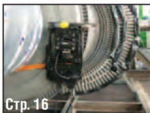
Стр. 16 ДЕФЕКТОСКОПИЯ И НЕРАЗРУШАЮЩИЙ КОНТРОЛЬ: НОВЫЙ ПОДХОД