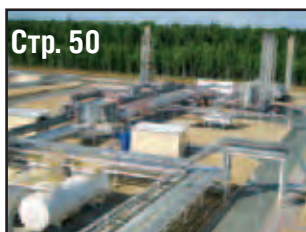
Стр. 50 КОНДИНСКИЙ НПЗ – ПИЛОТНЫЙ ПРОЕКТ БЕЗМАЗУТНОЙ СХЕМЫ ЗАВОДА. ОПЫТ ПРОЕКТИРОВАНИЯ И СТРОИТЕЛЬСТВА