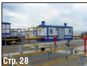
Стр. 28 К 70-ЛЕТИЮ ООО ЗАВОД «САРАТОВГАЗАВТОМАТИКА»