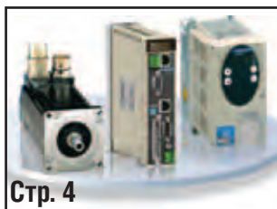
Стр. 4 ПЕРЕДОВЫЕ ТЕХНОЛОГИИ ЭНЕРГОЭФФЕКТИВНОСТИ, АВТОМАТИЗАЦИИ И УПРАВЛЕНИЯ ДВИЖЕНИЕМ