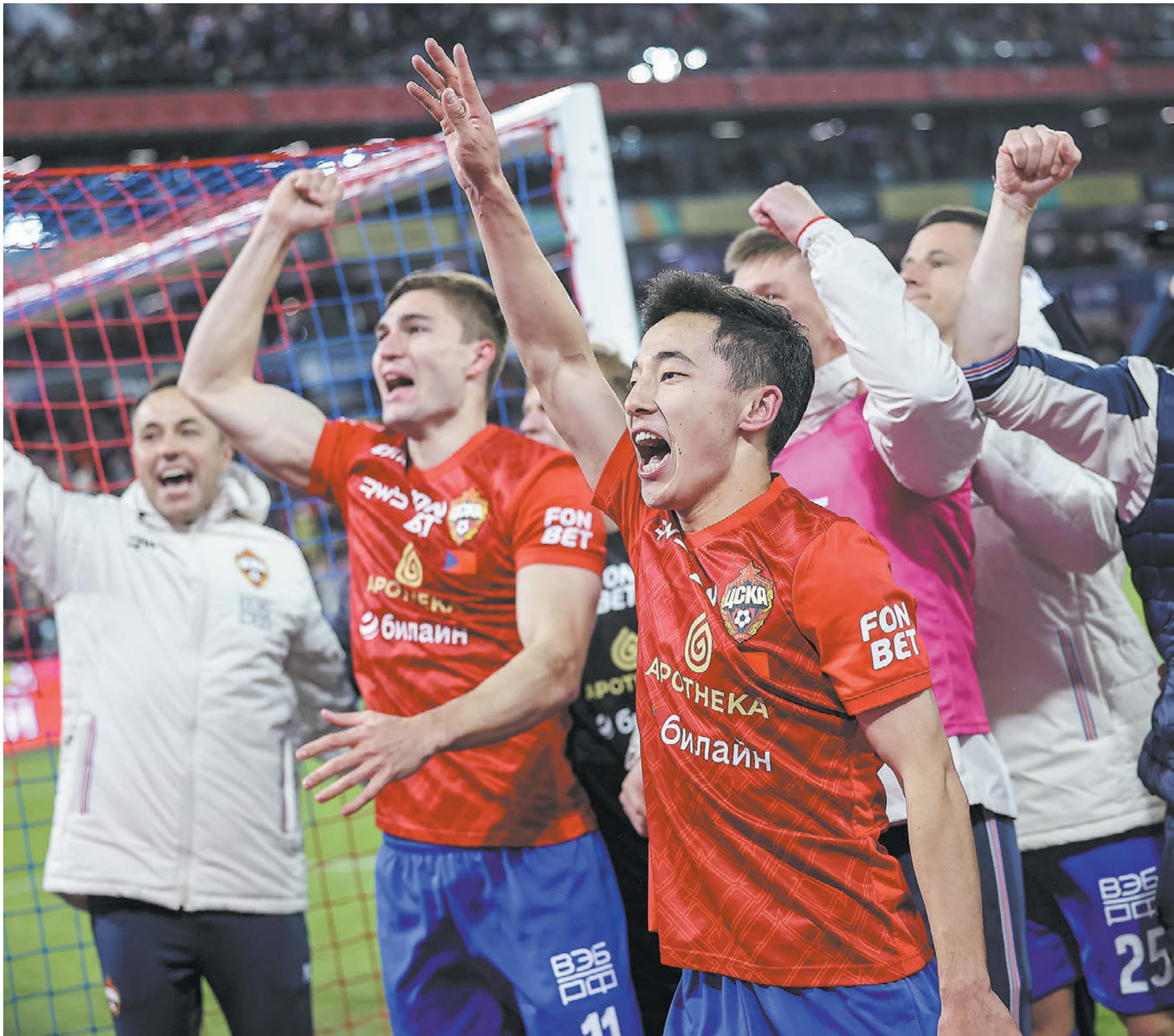
Вчера. Москва. ЦСКА – «Зенит» – 2:0 (пен. – 4:3). Армейцы празднуют суперпобеду

Вчера армейцы победили «Зенит» (2:0, пен. – 4:3) и вырвали путевку в суперфинал Кубка России