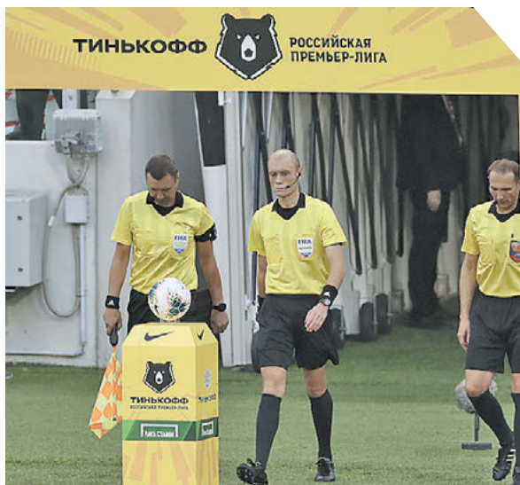
Александр Федоров «СЭ» / Canon EOS-1DX Mark II