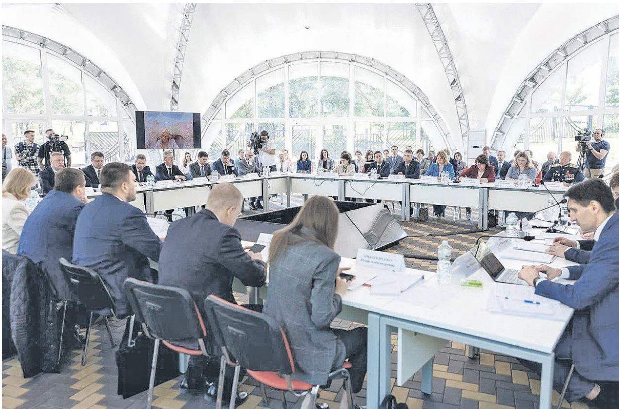
Мозговой штурм в Рязани.

К мероприятию в режиме видео-конференц-связи подключились представители регионов Центрального федерального округа и руководители межведомственных комиссий, которые помогают филиалам фонда на местах. «Такой формат заседаний позволяет получать обратную связь напрямую от филиалов фонда, представителей власти, ветеранов СВО и уделять особое внимание задачам, которые требуют доработки», — подчеркнула статс-секретарь — заместитель министра обороны РФ, председатель фонда «Защитники Отечества» Анна Цивилева. На заседании обсудили вопросы содействия военнослужащим, которые после возвращения домой хотят заниматься бизнесом и открыть своё дело.