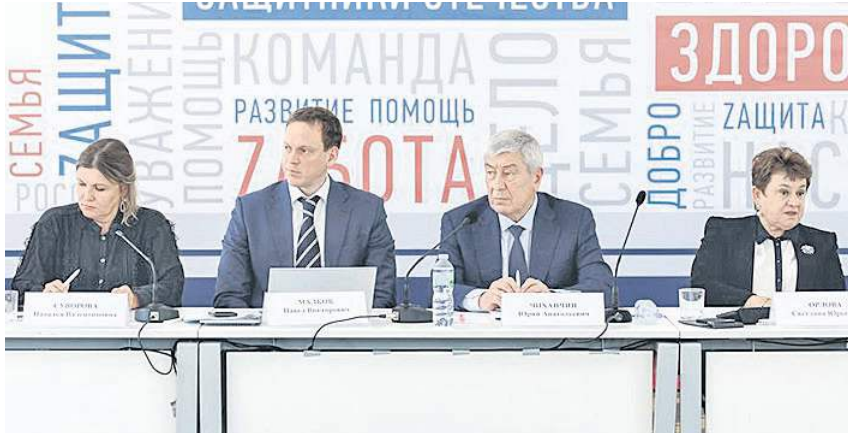
Чиновники подчинены единой цели.