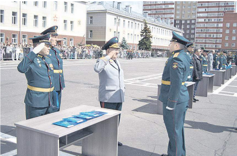
Так начинается жизнь офицерская...

В стенах легендарной Военной академии Ракетных войск стратегического назначения имени Петра Великого прошёл очередной выпуск.