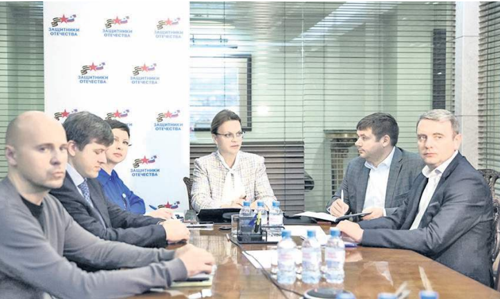
Фонд «Защитники Отечества» генерирует идеи и смыслы.