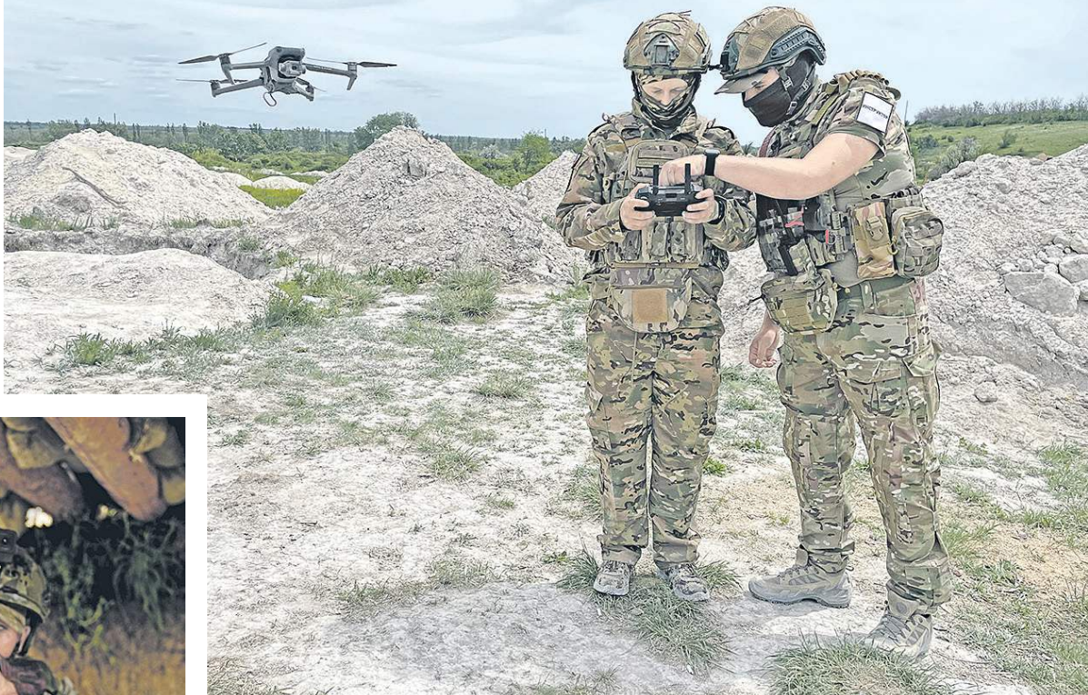
«Тайга» подсказывает новичку.

— Будем работать по очереди в тройках. Вы действуете в малой группе, а значит, важно постоянно поддерживать коммуникацию. Мне всё равно, какими жестами вы будете оперировать, но понимать друг дру-