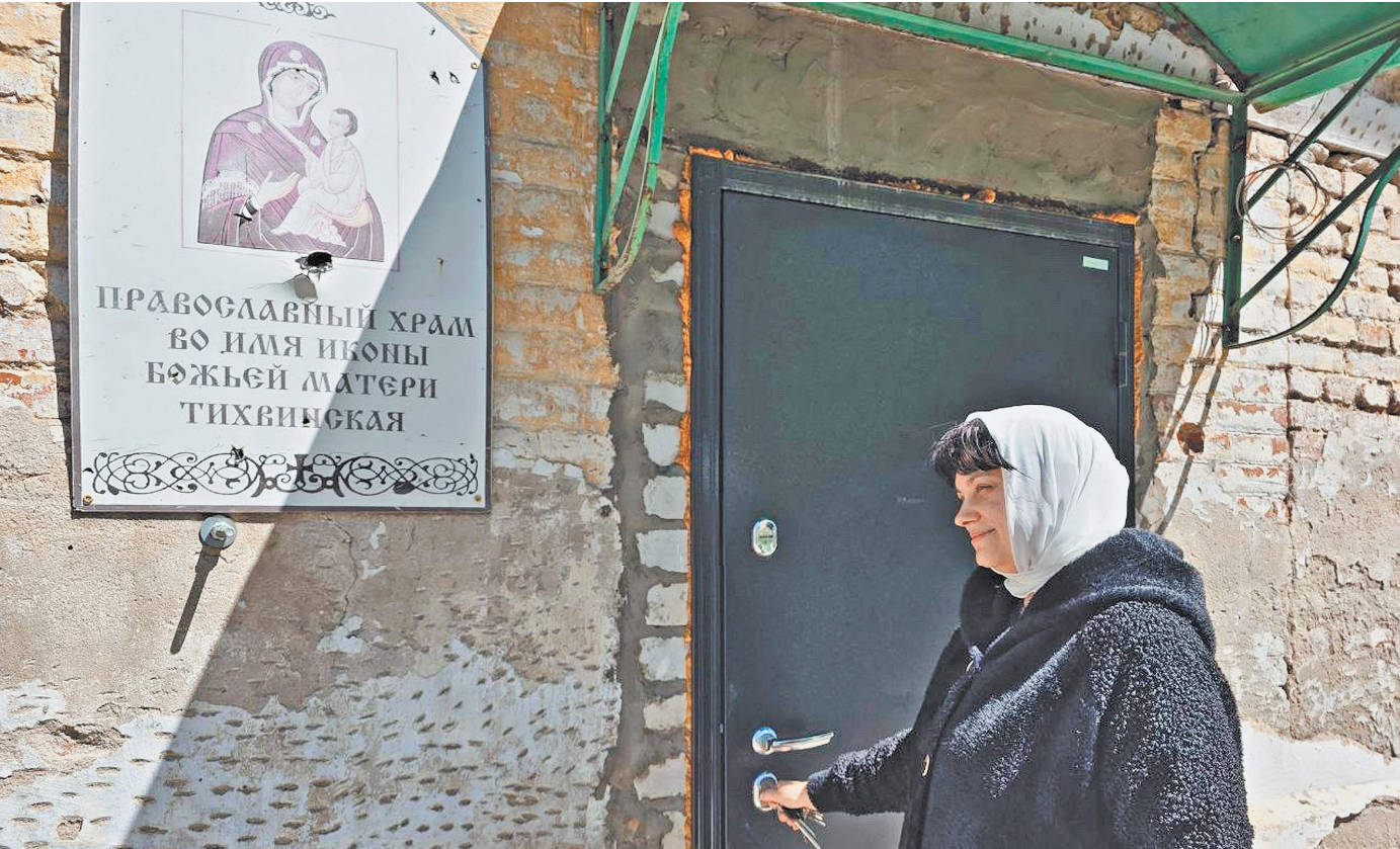
Тихвинскую церковь хотят отремонтировать и организовать здесь храм-мемориал.