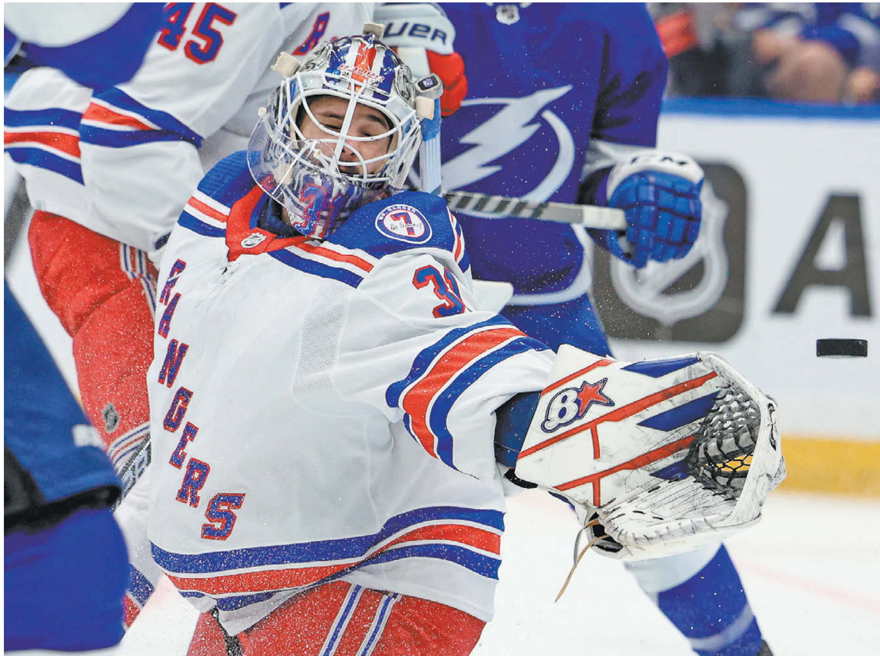
Игорь Шестеркин в матче плей-офф НХЛ против «Тампа-Бэй»

Большое интервью лучшего вратаря НХЛ этого сезона – об индивидуальных призах, плей-офф, падениях во вратарской и хейтерах среди чужих фанатов