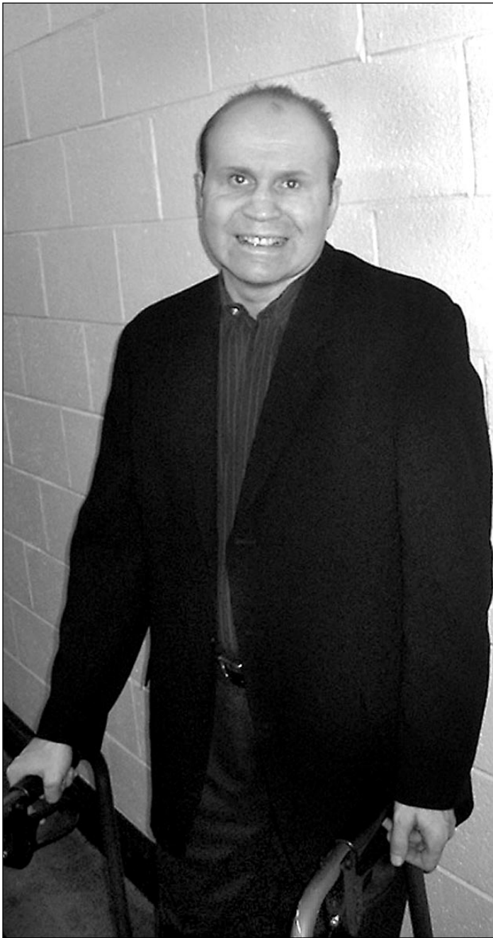
Понедельник. Детройт. Владимир КОНСТАНТИНОВ.