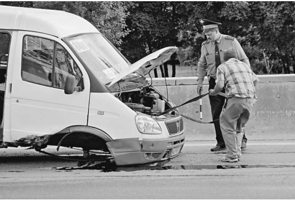
Минтранс предлагает в обязательном порядке оснастить автобусы и грузовики тахографами и системой ГЛОНАСС. В ведомстве полагают, что это сможет предотвратить многие аварии