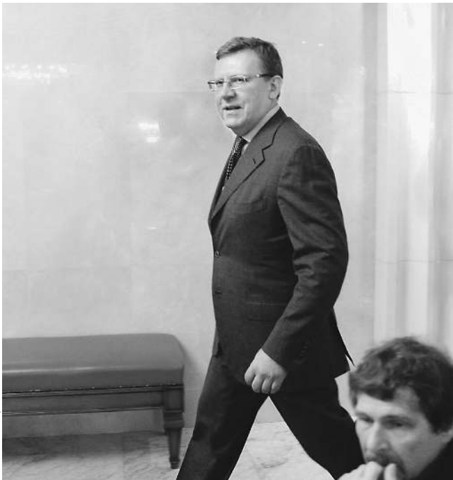
Появление Алексея Кудрина в здании правительства стало неожиданностью