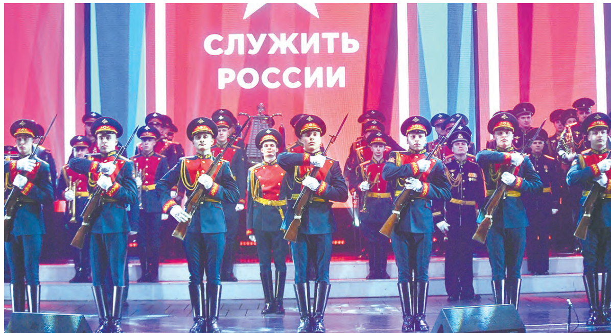
На сцене БКЗ «Октябрьский» красавцы-удальцы роты почётного караула

Санкт-Петербург – Москва