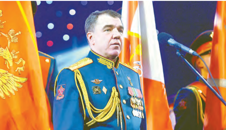
Собравшихся поздравляет командующий войсками ЗВО Герой России генерал-полковник Александр Журавлёв

Александр Беглов отметил, что возложение цветов 23 февраля у подножия стелы станет традиционным