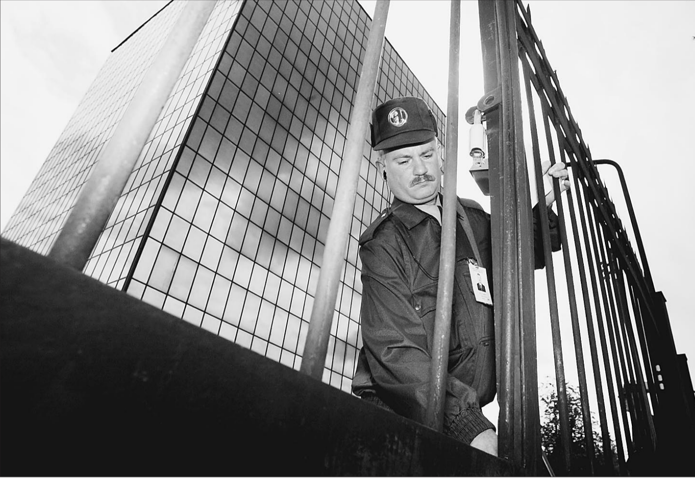
6 августа. Москва. Обыски в офисе компании «ЮКОС» на Загородном шоссе

Однако один из участников обыска в беседе с корреспондентом «Известий» категорически опроверг эту информацию. «Все действия сотрудников правоохранительных органов при изъятии электронного и компьютерного оборудования регламентированы требованиями УПК», — пояснил он. — На практике это выглядит следующим образом. Прежде всего необходимо обеспечить сохранность изымаемой информации. Для этого пресекается доступ в помещение, где установлено оборудование. Следует учесть, что при выполнении определенного защитного алгоритма действий — случайного или намеренного — может начаться процесс шифрования, данные могут частично или полностью уничтожиться. Поэтому на начальном этапе нужно исключить возможность запуска такого алго-