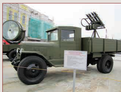
Зенитная ▲ пулемётная установка М4