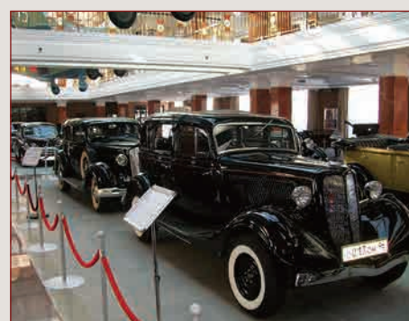
➤ В выставочном зале