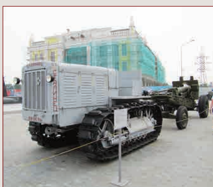
Дизель-тягач «Сталинец» ▼