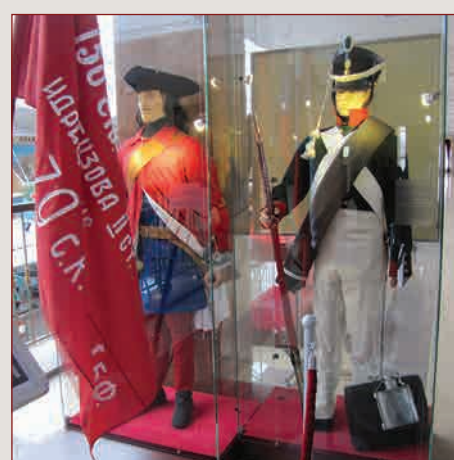
▲ Военная униформа