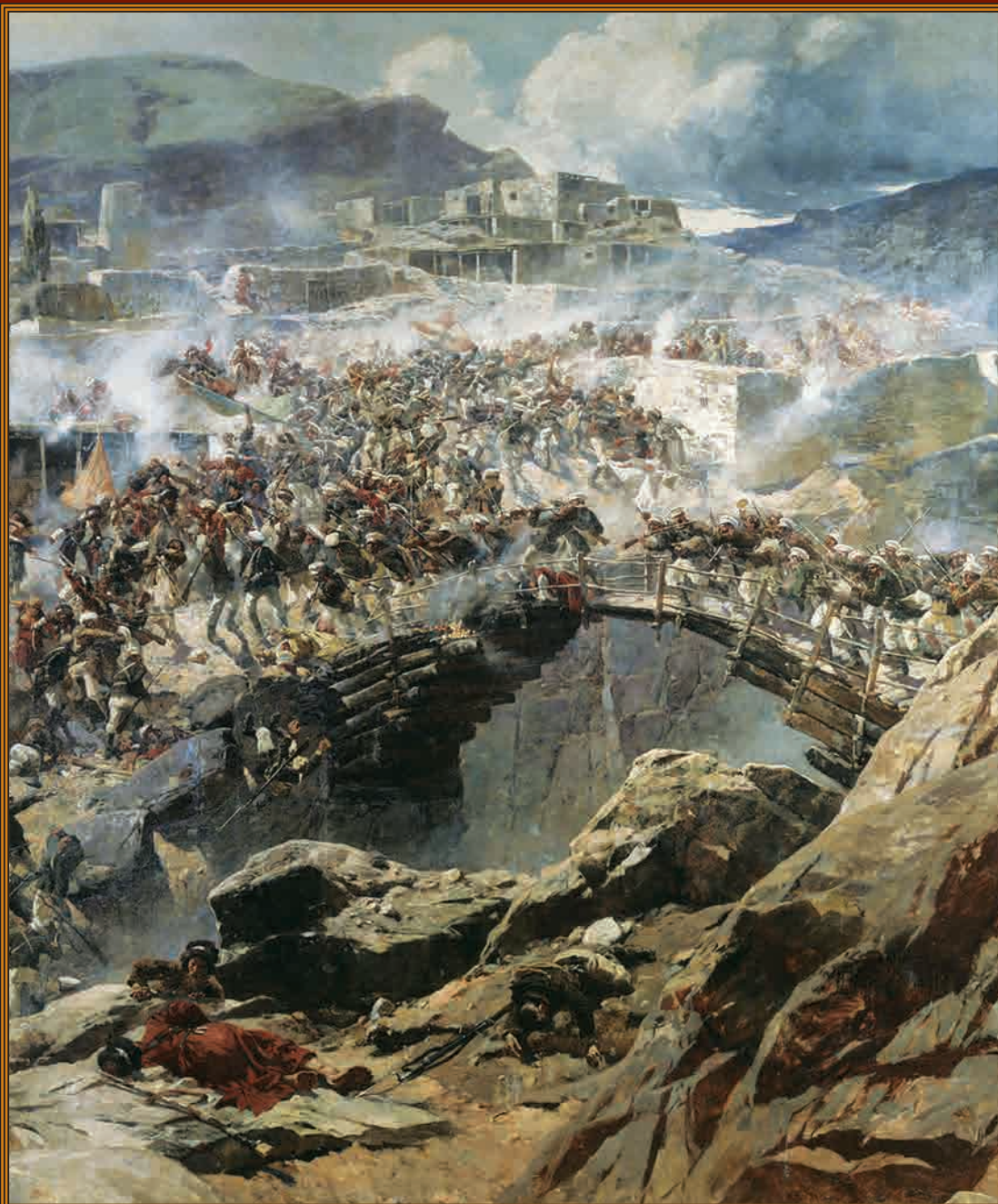
Штурм аула Ахульго