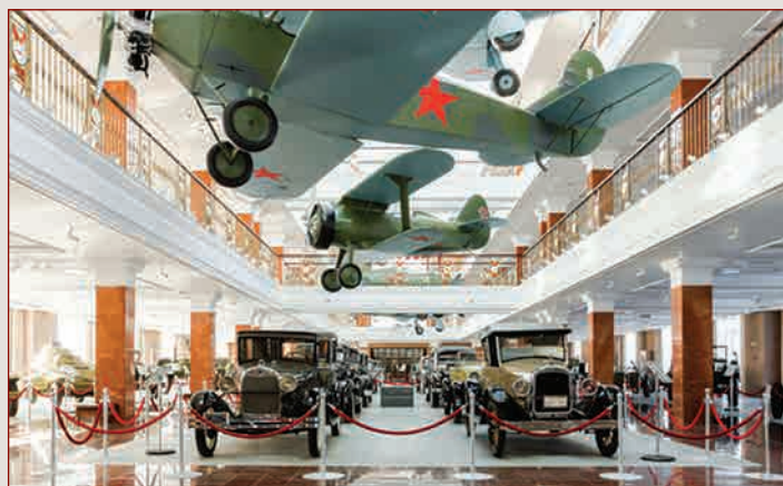
«Мы выпьем раз, и выпьем два за наши славные «У-2»»