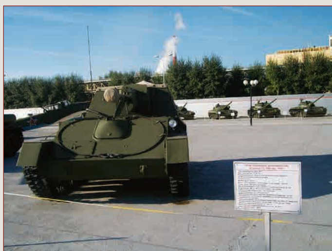
▲ САУ СУ-76М образца 1943 г.