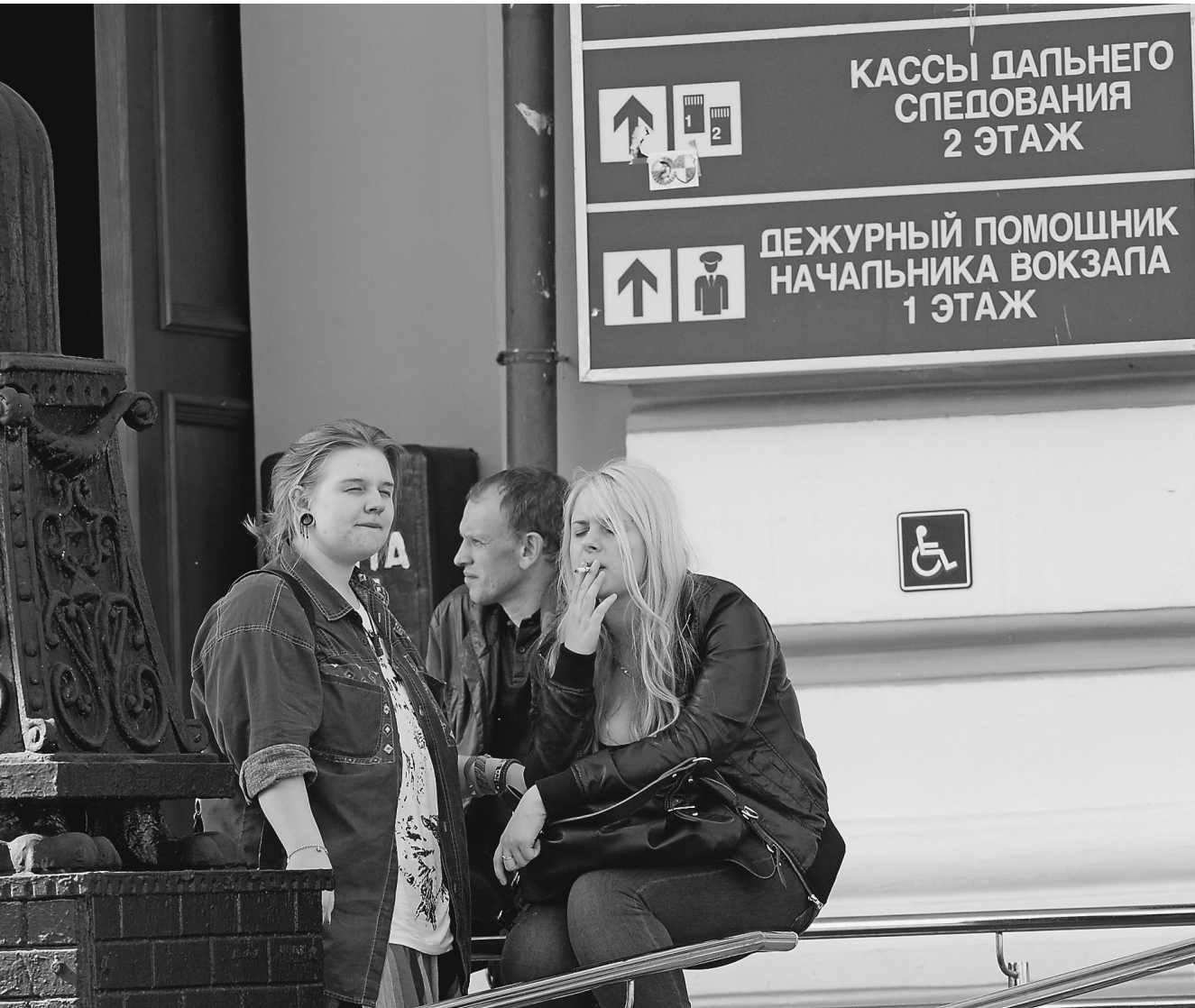
Пока курильщики еще могут подпирать стены вокзалов