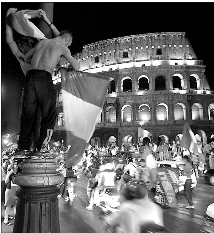
Вечный город - Рим - видел немало триумфов. Во вторник он пережил еще один.

- Да, команда Липпи заслужила эту победу. Впервые на турнире сборная Италии играла не в столь привычном для нее оборонительном стиле. Решили же игру, на мой взгляд, три игрока - Пирло, Тотти и Гаттузо. Важно и то, что в концовке появился свежий Дель Пьеро, отлично забивший второй гол. Вообще у Италии много опытных игроков, во многом благодаря которым команда успешно выступает на турнире.