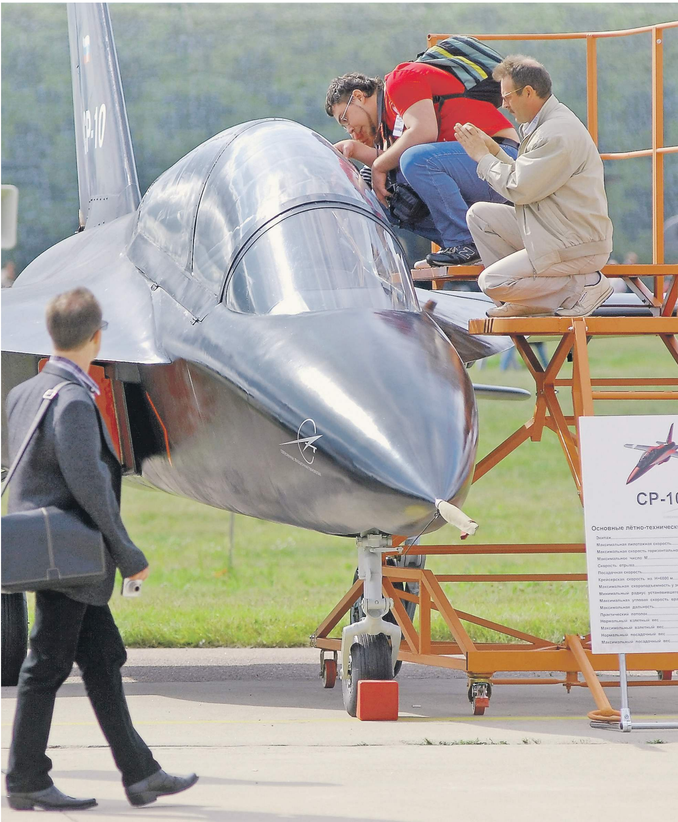
Отечественные пилоты будут учиться на отечественном самолете