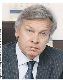
Госдума А.А. Пушков

Западные санкции, попытки изолировать Россию привели — с точки зрения парламентской дипломатии — к достаточно драматическим последствиям. В апреле 2014 года российская делегация покинула Парламент-