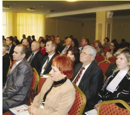
«Сельскохозяйственная потребительская кооперация – 2008»: достижения и проблемы