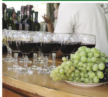
Виноградный рай России