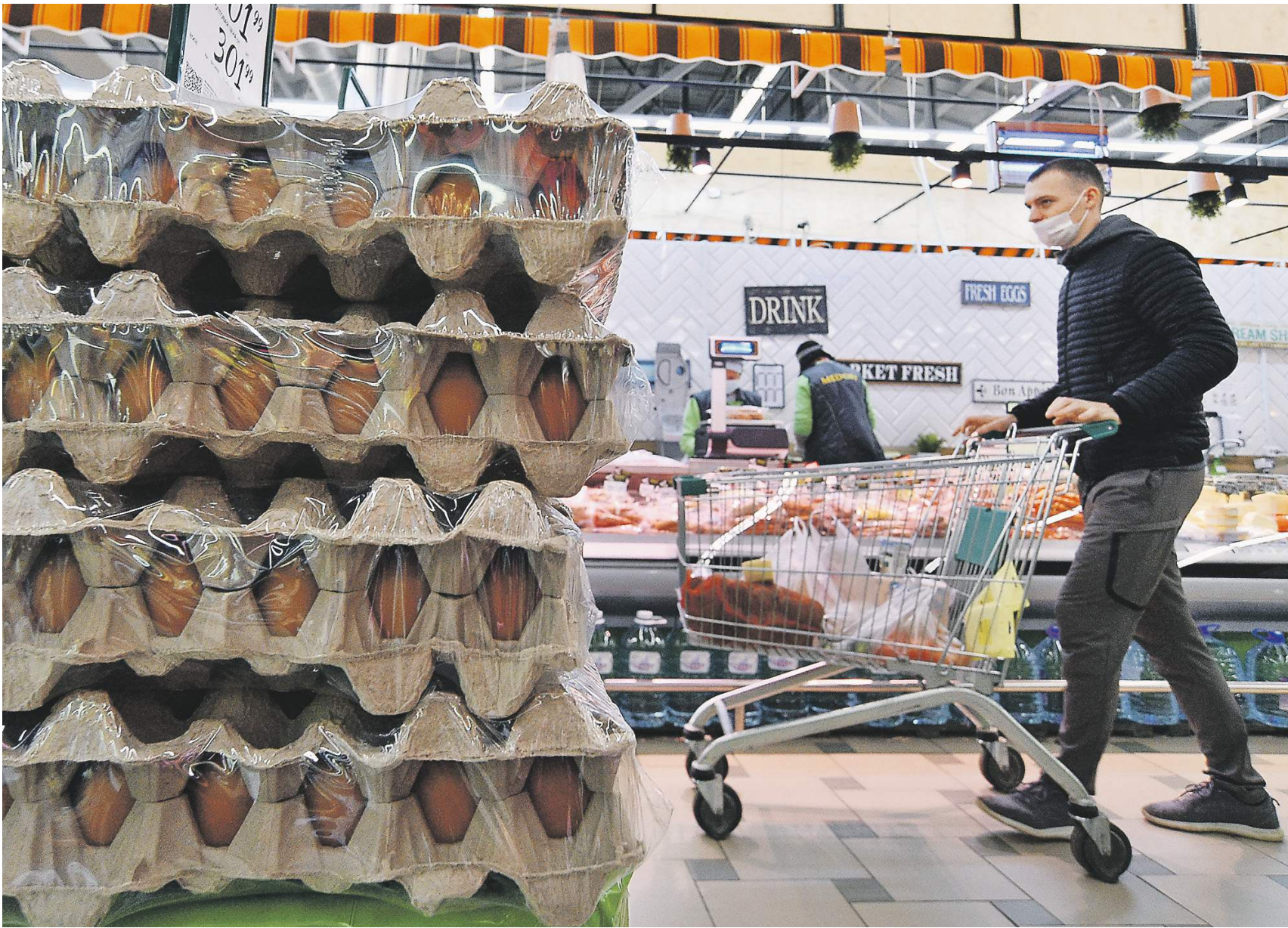
Александр Погребенько / Известия