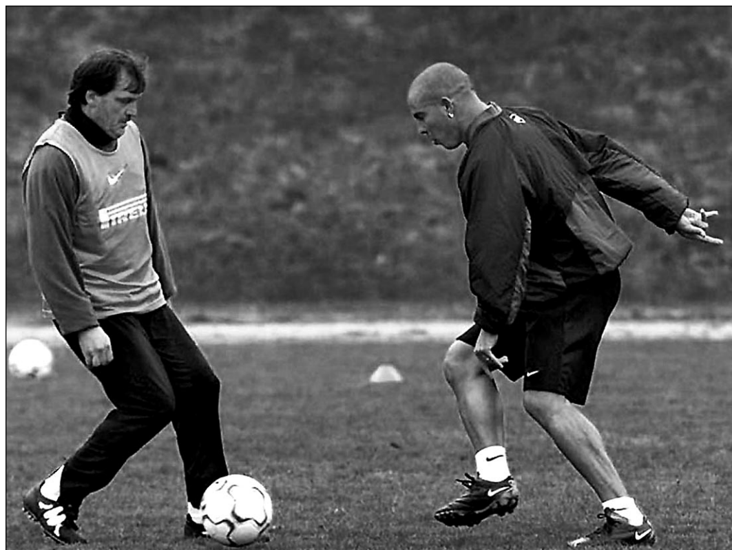
Вчера РОНАЛДО готовился к полуфиналу ЧМ-2002 в японской Саитеме под руководством Луиза Фелипе СКОЛАРИ (на нижнем снимке - справа). А всего год назад знаменитого бразильского нападающего тренировал в «Интер» Марко ТАРДЕЛЛИ (вверху - слева). Тот самый Тарделли, услуги которого итальянская фирма Promosport сегодня предлагает сборной России.

Работал в сериях A и B, тренировал «Падову», «Торино», «Эмполи». В Испании короткое время возглавлял «Тенерифе». В настоящее время работает комментатором на RAI.