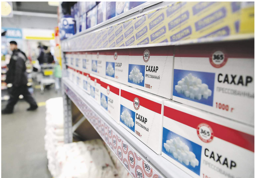
Корней Кузнецов / ИКС