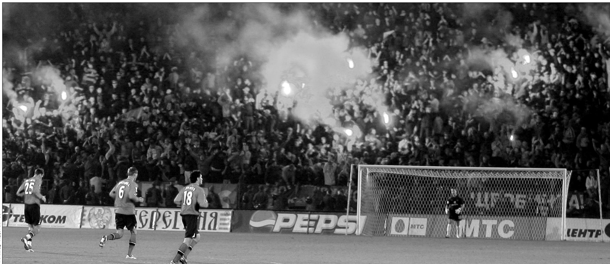
Воскресенье. Раменское. «Сатурн» - ЦСКА - 2:2. Файеры на трибунах стали уже неотъемлемой частью российского футбола. И зачастую вызывают головную боль у руководителей клубов.

Как уже сообщал «СЭ», 5 октября на заседании КДК УЕФА будет рассмотрен вопрос о поведении болельщиков ЦСКА на матче Лиги чемпионов с «Гамбургом», во время которого на поле московского стадиона «Локомотив» были брошены файеры