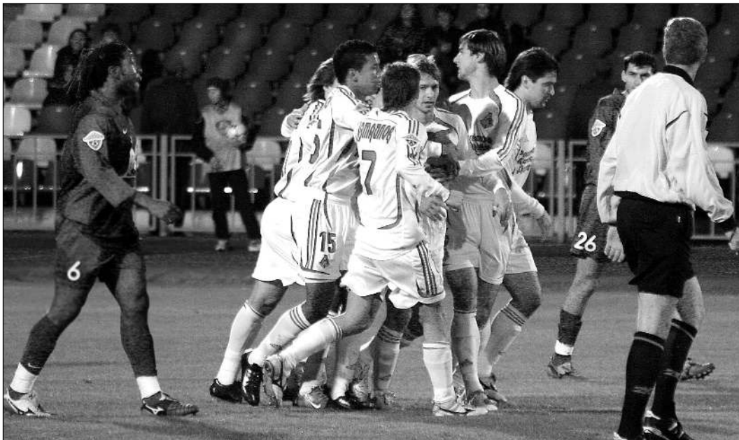
Вчера. Казань. «Рубин» - «Локомотив» - 2:4. 27-я минута. Только что Дмитрий СЫЧЕВ (в центре) забил первый из четырех голов «Локо».

14 октября: ЦСКА - РУБИН, СПАРТАК - ЗЕНИТ, ЛОКОМОТИВ - МОСКВА, АМКАР - САТУРН, ЛУЧ-ЭНЕРГИЯ - ДИНАМО, СПАРТАК НЧ - ТОРПЕДО. 15 октября: РОСТОВ - ТОМЬ, КРЫЛЬЯ СОВЕТОВ - ШИННИК.