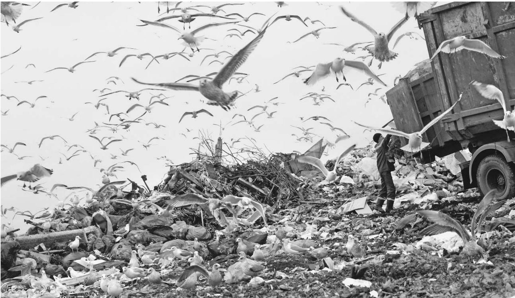
Полигоны твердых бытовых отходов уже давно представляют серьезную экологическую угрозу