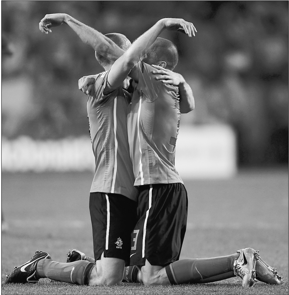
Вчера. Порт-Элизабет. Голландия - Бразилия - 2:1. Голландское счастье: Андре ОЗЙЕР (слева) и Джон ХАЙТИНГА.