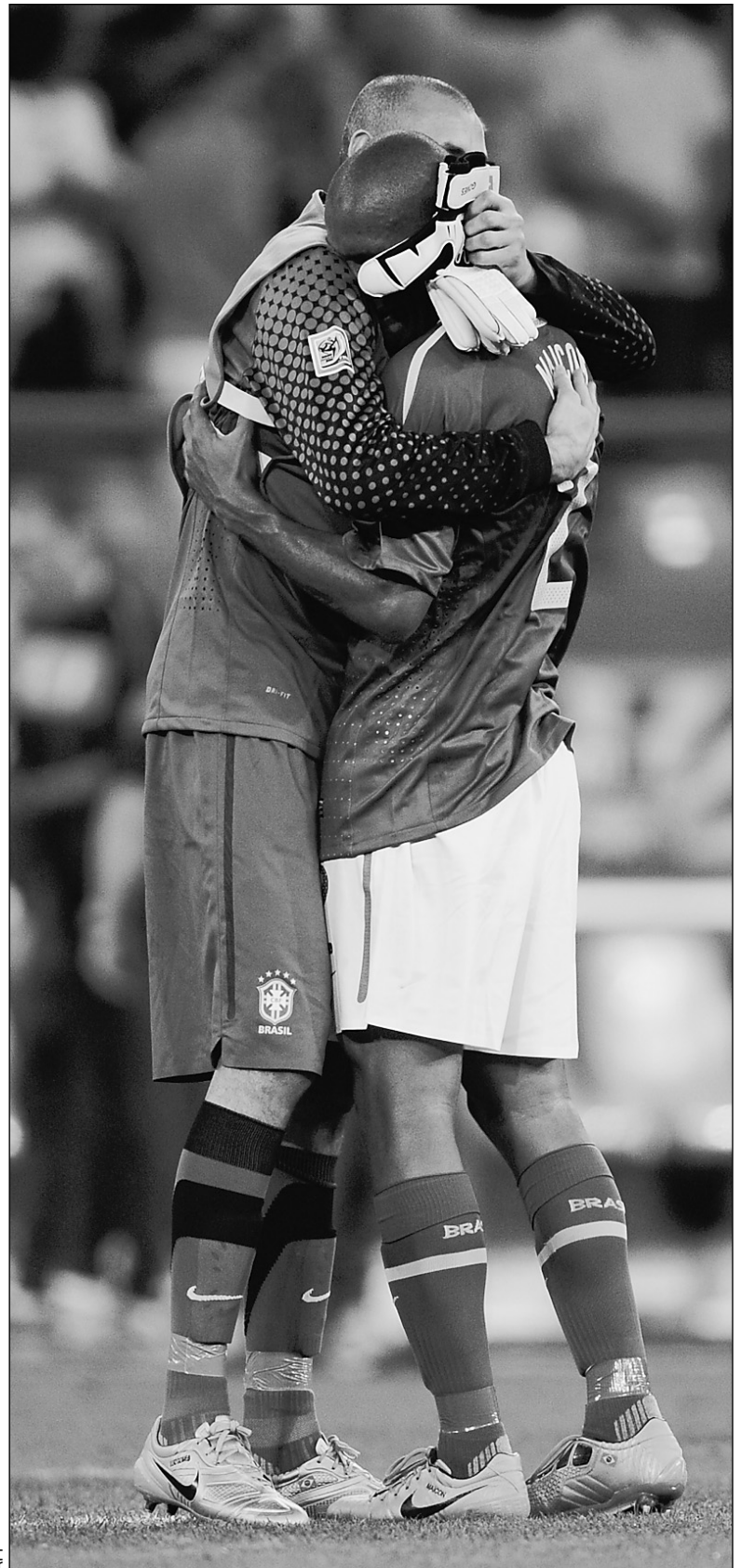
Бразильские слезы: ЖУЛИУ СЕЗАР (слева) и МАЙКОН.

В общем, сейчас нам только и остается - утешаться предположениями о том, как далеко сборная России продвинулась бы в ЮАР, если уж такие голландцы оставили за бортом главного фаворита чемпионата.