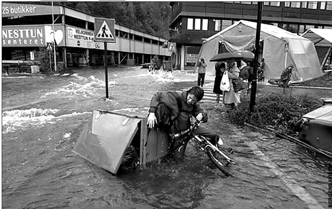
Вот как выглядели улицы Бергена еще сутки назад.