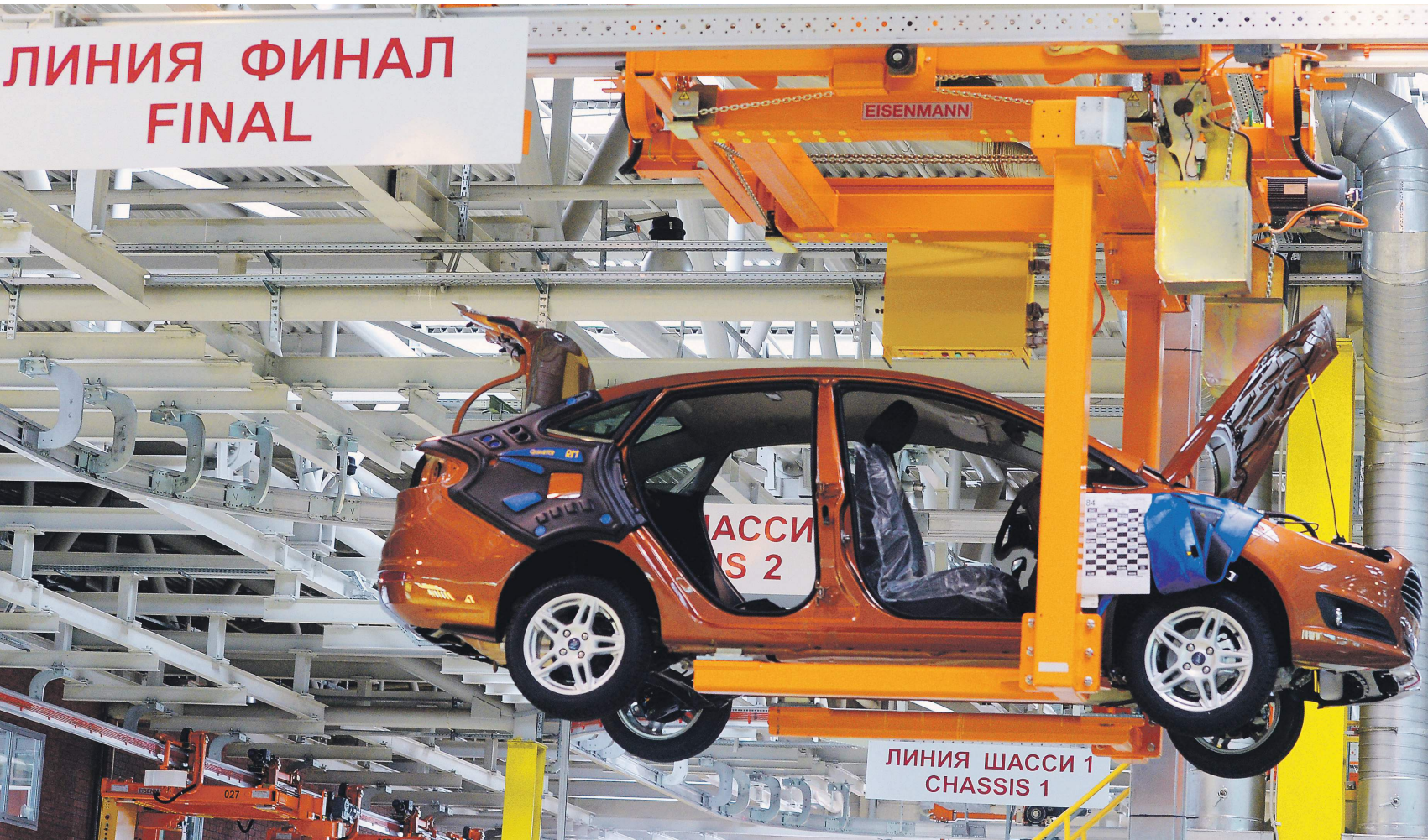
На заводе в Набережных Челнах Ford Fiesta собирают с 2015 года