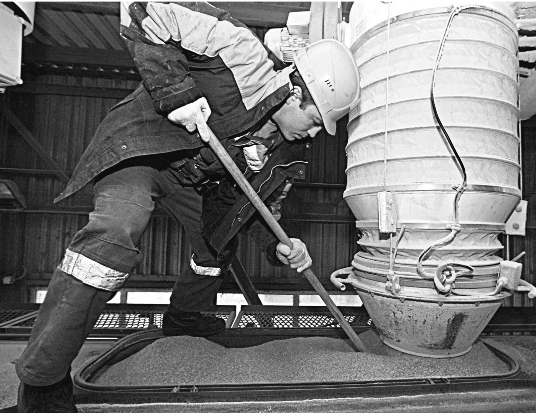
ИГОРЬ ЗАРЕЧЕВ / РИА НОВОСТИ