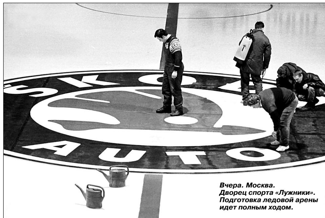
Вчера. Москва. Дворец спорта «Лужники». Подготовка ледовой арены идет полным ходом.