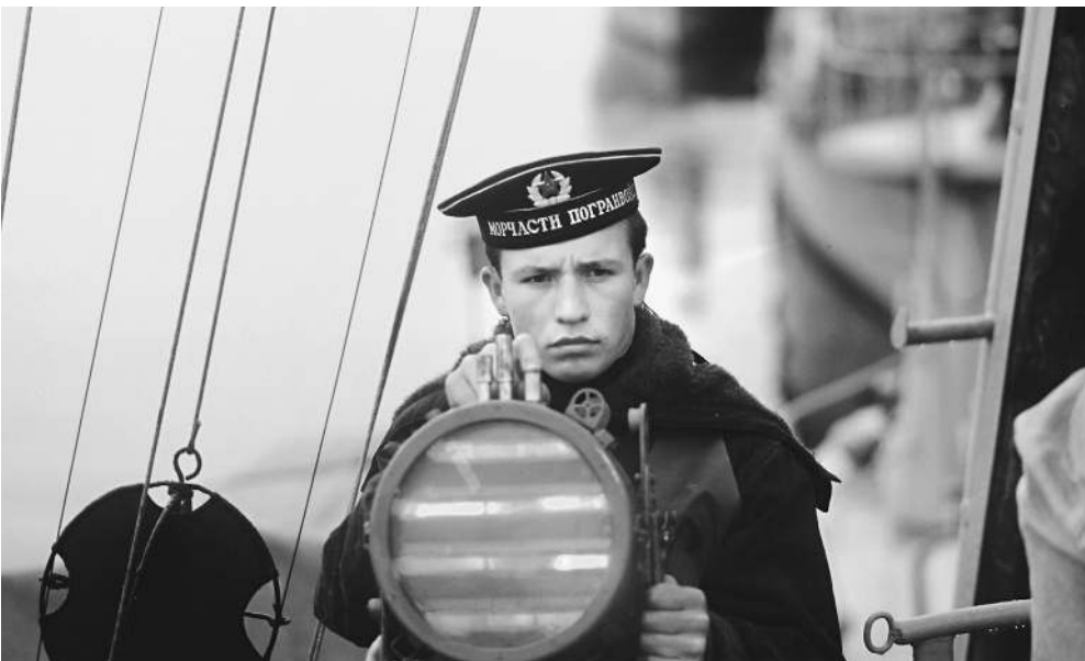
Азбуку Морзе никто не отменял, но для ее применения необходимо электричество