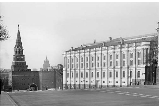
Региональные руководители будут держать ответ перед центральной властью

Комментируя итоги голосования, лидер списка партии власти, президент Дмитрий Медведев еще в понедельник заявил, что «Единая Россия» «получила ровно ту поддержку, которую имеет от наших граждан, ни больше, ни меньше». И хотя в Госдуме у ЕР по результатам выборов, заявил президент, «по сути абсолютное большинство», это не значит, что никаких выводов делать не надо. Медведев заявил, что нужно обратить внимание на те регионы, где «люди наши отказали в серьезном доверии «Единой России». «Это означает, что региональная власть все-таки работает не так, как хотелось бы. Но это уже скорее вопрос для организационных выводов, которые должны буду сделать я, как президент Российской Федерации, я об этом губернаторов предупреждал», — заключил президент.