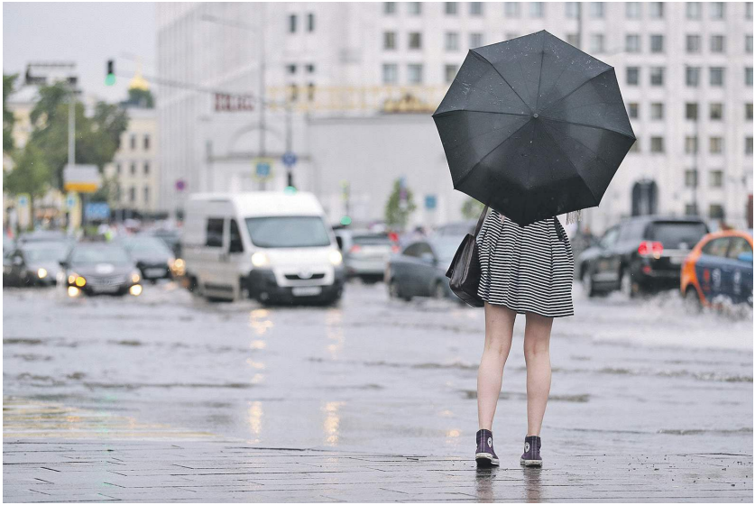
Через два года прогнозы погоды станут точнее на 30% | Александр Казаков | «Изнестия»