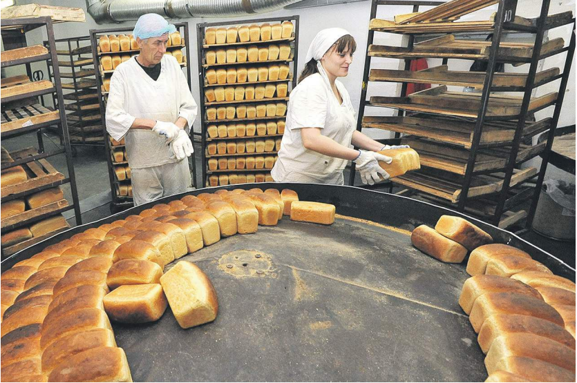
Бессолевой хлеб будет способствовать снижению риска сердечно-сосудистых заболеваний

— Опыт других стран показывает эффективность уменьшения содержания соли в составе хлебобулочных изделий. Это изменение можно реализовать за счет внесения поправок в техрегламенты, — отметил эксперт. 04 →