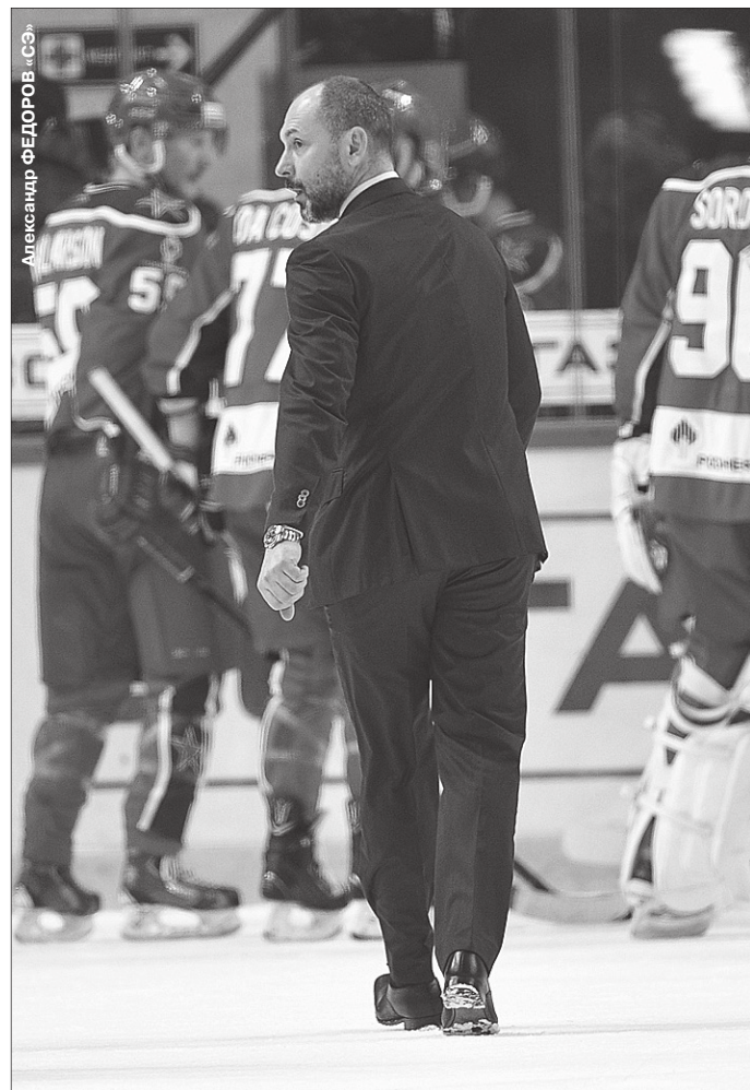
Александр Овечкин

КХЛ. КУБОК ГАГАРИНА. 1/2 финала. ЦСКА — СКА — 3:0