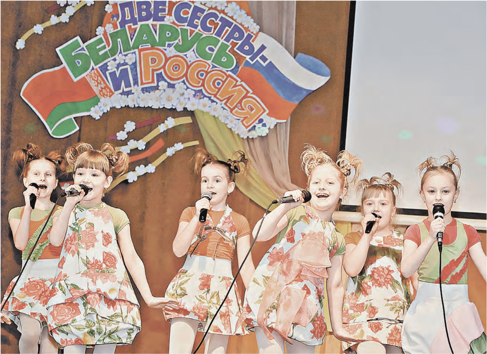
Конкурс собрал около 200 участников из Беларуси и России.

— Интересно было увидеть Летний амфитеатр, где проходят концерты «Славянского базара». На лошадках покататься по