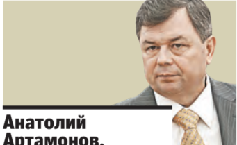
Анатолий Артамонов, губернатор Калужской области:

— Наша область крайне заинтересована во всестороннем расширении сотрудничества с белорусскими партнерами. Хочется, чтобы это сотрудничество росло в таких актуальных для нас направлениях, как жилищное строительство и сельское хозяйство. Калужане успешно используют наработку белорусских коллег в авиарной сфере. В нашей особой экономической зоне в Людиново можно наладить производство на взаимовыгодных условиях. Найдется место для белорусских предпринимателей и в индустриальном парке «Грибцево».