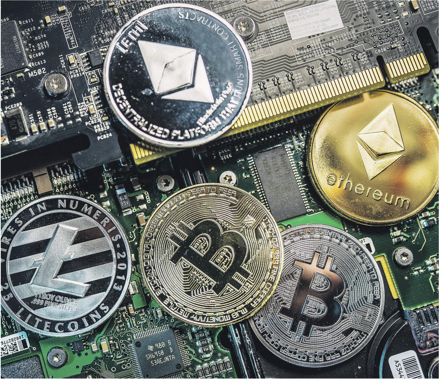
Физлица будут платить с прибыли от оборота криптовалют 13-процентный подоходный налог