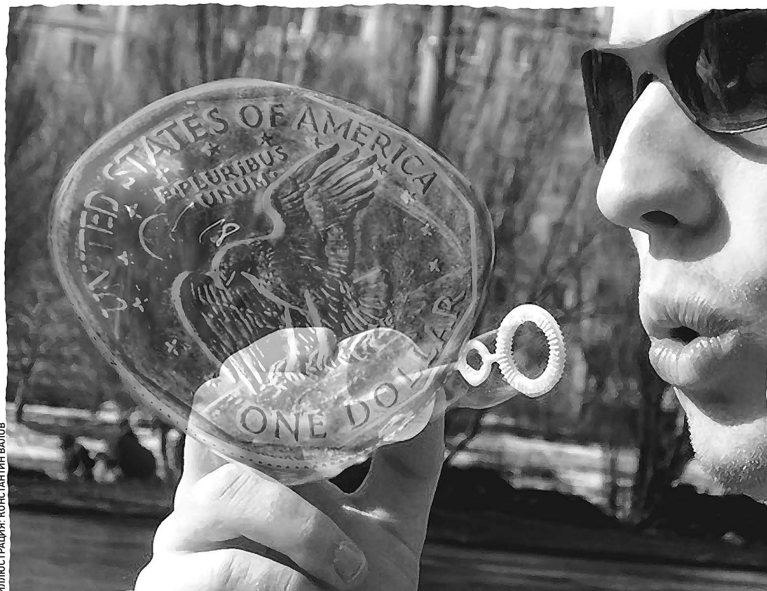
ИЛЛЮСТРАЦИЯ: КОНСТАНТИН ВАЛОВ

Доллар продолжает расти. Уже давно он столько не стоил — 27,30 рубля. Почему на фоне общего упадка в США доллар набирает вес? Оказывается, Америка искусственно раздувает спрос на свою валюту, одновременно включив «печатный станок». Капиталы снова текут за океан, создавая «мыльный пузырь». Но пузыри имеют обыкновение лопаться. Если доллар рухнет, многим придется несладко. «Известия» с помощью экспертов предлагают свою версию того, чего ждать от американской валюты. → стр. 4