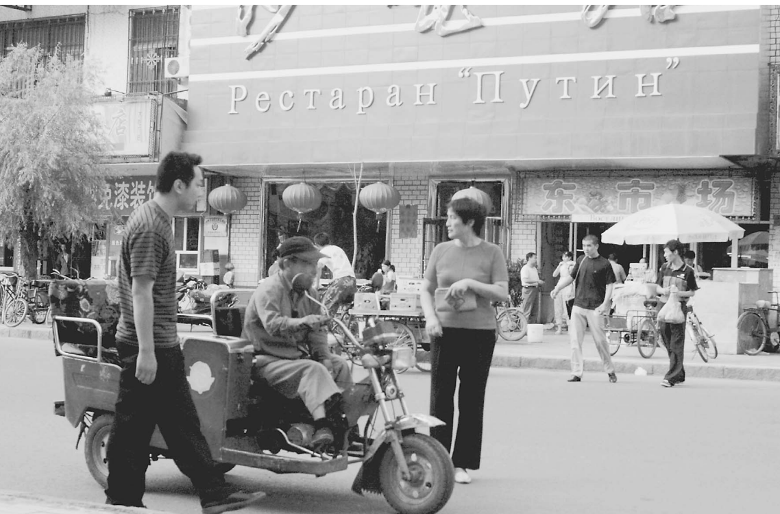
Город Хэйхэ, Китай. На одной из улиц города расположен ресторан «Путин»

Премьер-министр Владимир Путин провел вчера в Москве плодотворные переговоры с премьером Госсовета КНР Вэнь Цзябао, по итогам которых была подписана сразу дюжина документов. Впрочем, в их числе не оказалось одного важного соглашения, которое, если верить появившимся днем ранее во многих СМИ сообщениям, очень ждали. Речь идет о некоем контракте, по которому «Роснефть» и «Транснефть» будут поставлять в Китай около 15 млн тонн нефти в год в течение то ли 15, то ли 20 лет в обмен на предоплату то ли в 20, то ли в 25 миллиардов долларов. Российская сторона между тем по итогам переговоров убеждала журналистов: о конкретике сейчас говорить рановато. При этом представители правительства говорили, что на переговорах речь шла и о конкретных вещах. → стр. 2