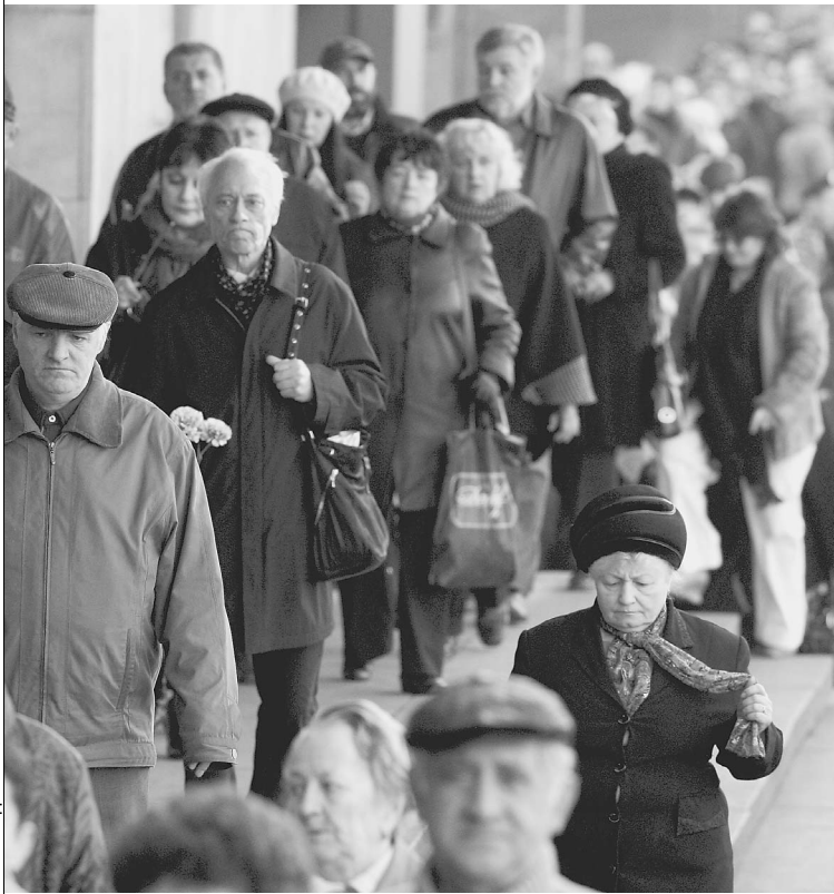
Очередь у Зала Чайковского начала собираться с восьми часов утра

Народу пришло значительно больше, чем рассчитывали. Возникли даже мелкие потасовки между пожилыми поклонниками певца за более выгодное место в зале, так как они хотели не только проститься с любимым актером, но также получше разглядеть всех присутствующих знаменитостей и даже взять автограф. Охрана быстро и корректно пресекала подобные инциденты. → стр. 5