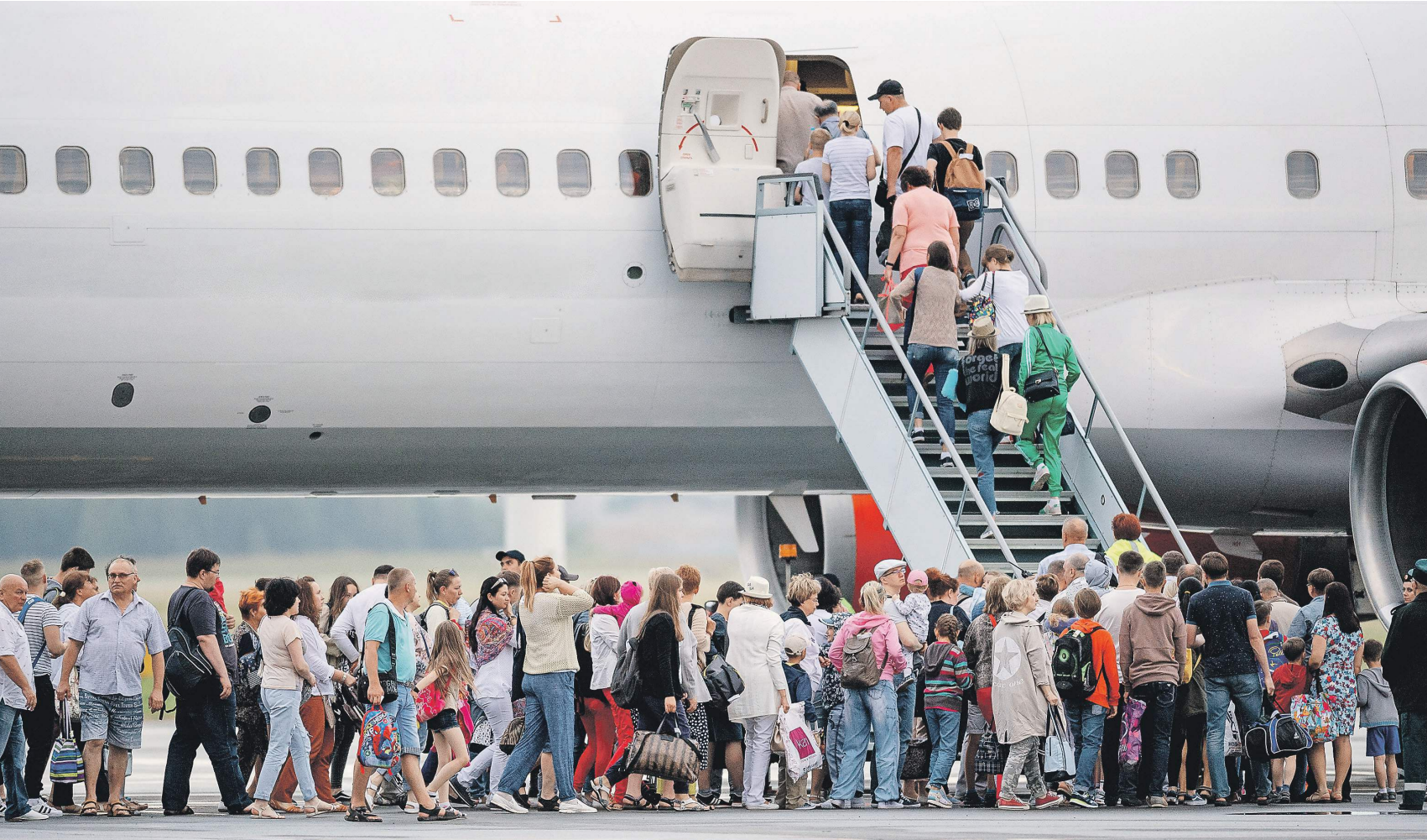
Росавиация не только вводит новую систему эвакуации пассажиров, но и серьезно ужесточает требования к авиакомпаниям

Постановление правительства № 1177 от 31 декабря 2009 года определяет условия предоставления суб-