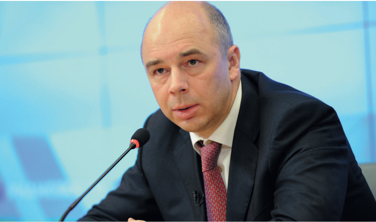
Антон Силуанов считает, что правоохранительные органы должны помогать бизнесу. oko-planet.ru

«Яндекс» и производитель корма для кошек и собак Purina открыли сервис для поиска пропавших домашних животных. Проект запущен в тестовом режиме в Екатеринбурге, но вскоре появится в Москве и других крупных городах.