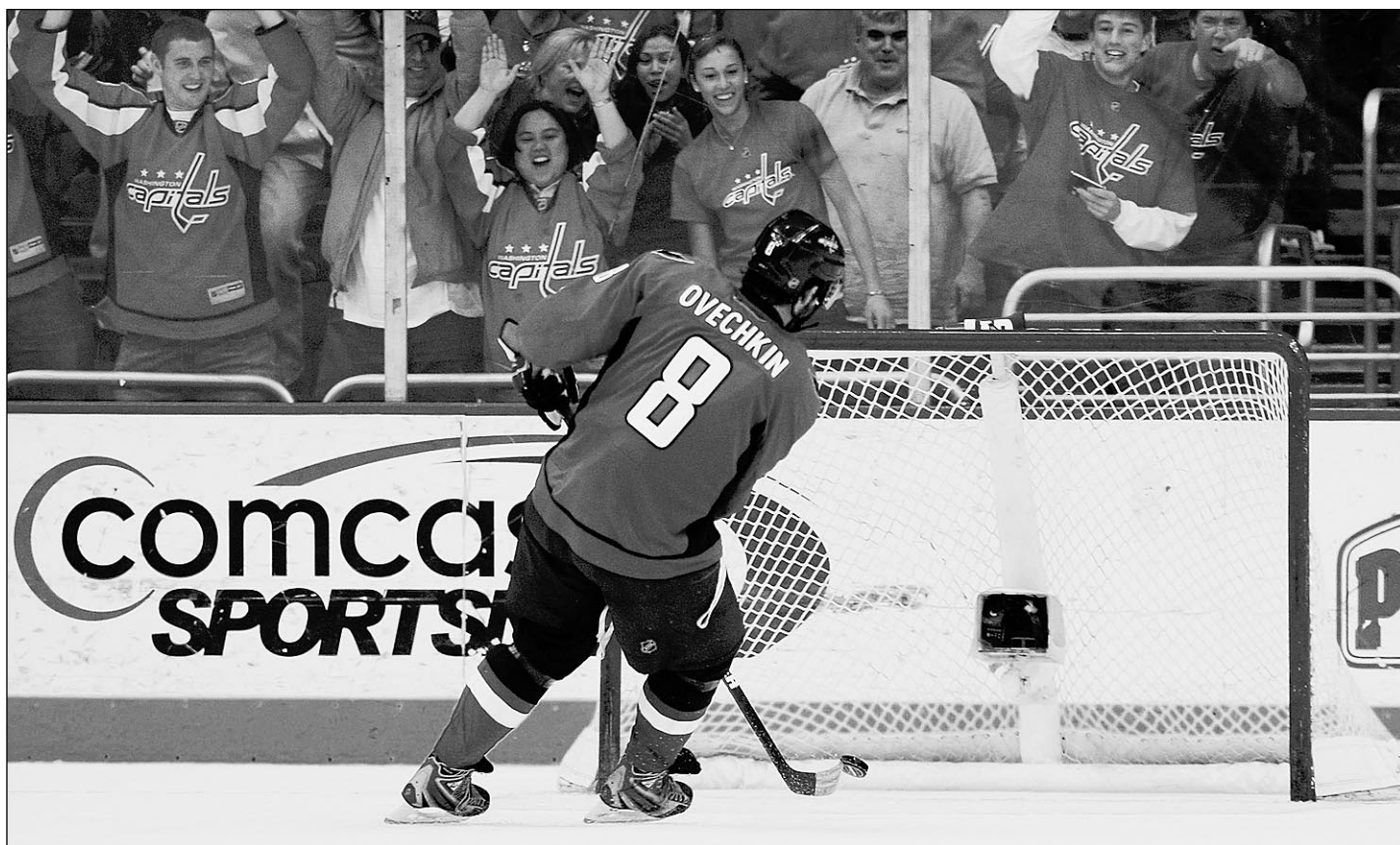
Суббота. Вашингтон. «Вашингтон» - «Тампа-Бэй» - 5:3. Александр ОВЕЧКИН поражает пустые ворота гостей и набирает 100-е очко в сезоне.