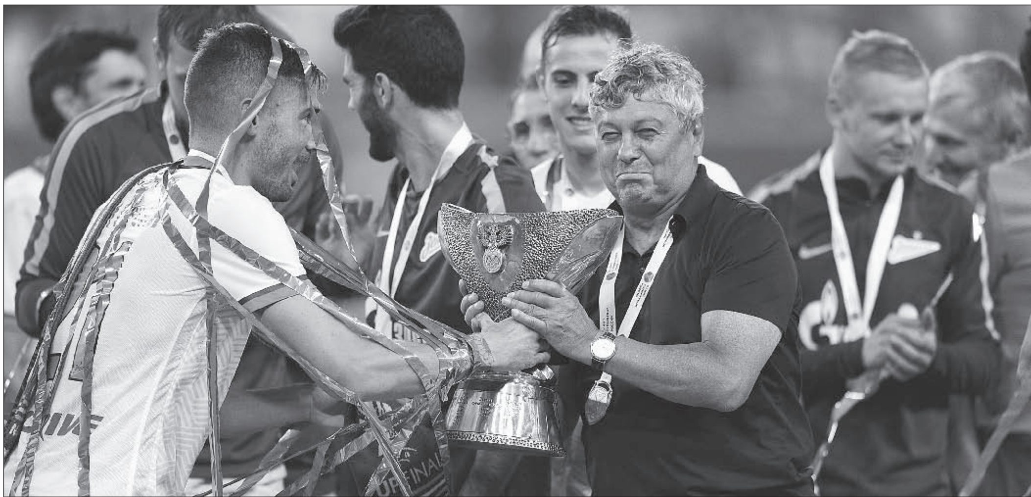
23 июля. Москва. Черкизово. ЦСКА - «Зенит» - 0:1. Испанский полузащитник питерцев ХАВИ ГАРСИЯ (слева) и главный тренер команды Мирча ЛУЧЕСКУ с Суперкубом России.

Главный тренер «Зенита» дал эксклюзивное интервью «СЭ». В нем он подвел промежуточные итоги своей работы, похвалил «Спартак», рассказал о состоянии российских сборников и поддержал Александра Кокорина.