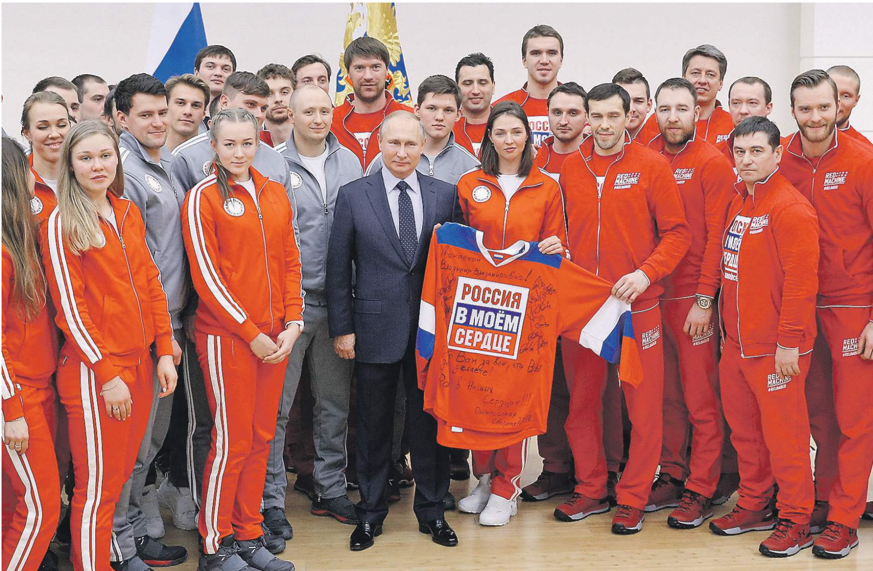
Президент попросил у спортсменов прощения за негатив, который обрушился на них после допингового скандала

— Вы знаете, в отношении многих из них было заявлено, что их не допускают по совокупности обстоятельств,