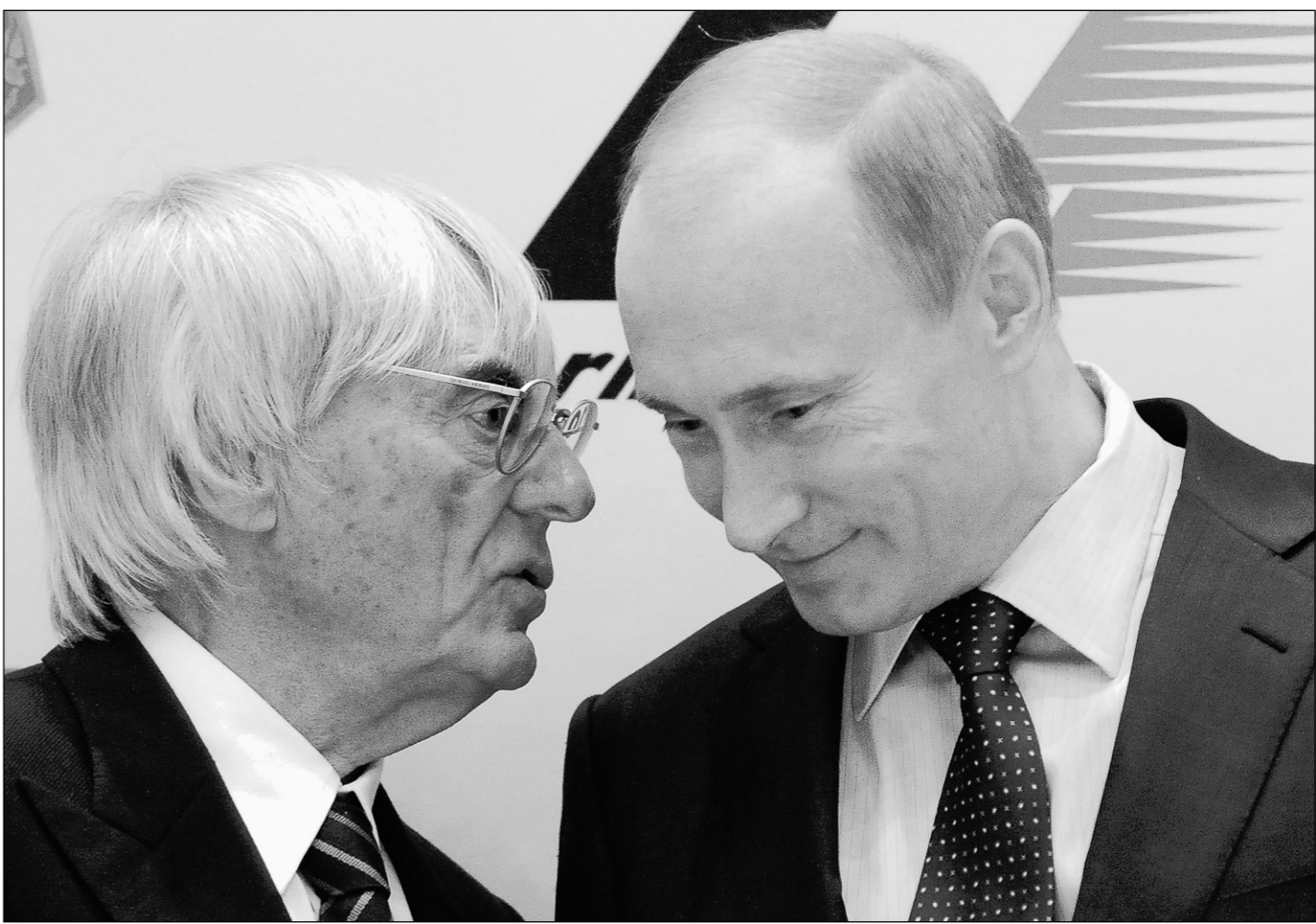
Вчера. Сочи. Владимир ПУТИН и Берни ЭККЛСТОУН.