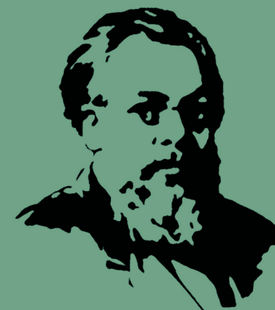
С. П. Боткин

Благодарим вас за доверие к нашим изданиям.