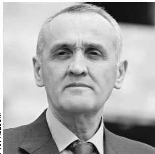
Александр Анква надеется, что выборы в Абхазии пройдут спокойно

— Александр Золотинский, на нынешних выборах столкнутся самые известные люди в Абхазии. Мы помним, что в 2004-м Абхазия долгое время не могла определиться с президентом. В Сухуме собирались вооруженные сторонники кандидатов. Что сейчас происходит в республике? — Такая ситуация не должна повториться! И то, что все кандидаты хорошо известны в республике, является решающим фактором. Что касается ситуации в канун выборов, то могу оценить ее как достаточно напряженную. Есть некоторые тенденции к искусственному нагнетанию обстановки, воздействию на избирателей методами не совсем корректными. Согласитесь, опыт проведения альтернативных, демократических выборов в стране пока еще невелик. Но это вопрос времени.