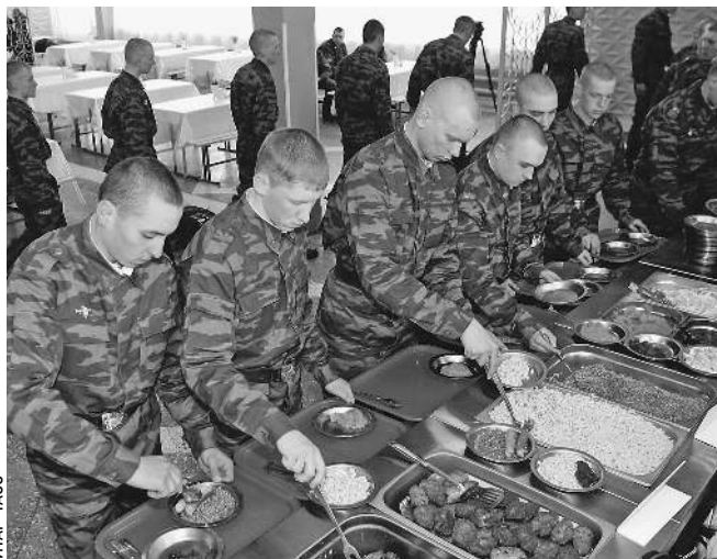
Теперь многие могут позавидовать солдатскому пайку

Однако к 1 сентября 2011 года на питание в гражданских столовых будут переведены 420 воинских частей и учреждений Минобороны общей вместимостью почти 395 тыс. человек. А до конца 2012 года общая численность питающихся на условиях аутсорсинга будет доведена до 515 тыс. солдат и офицеров.