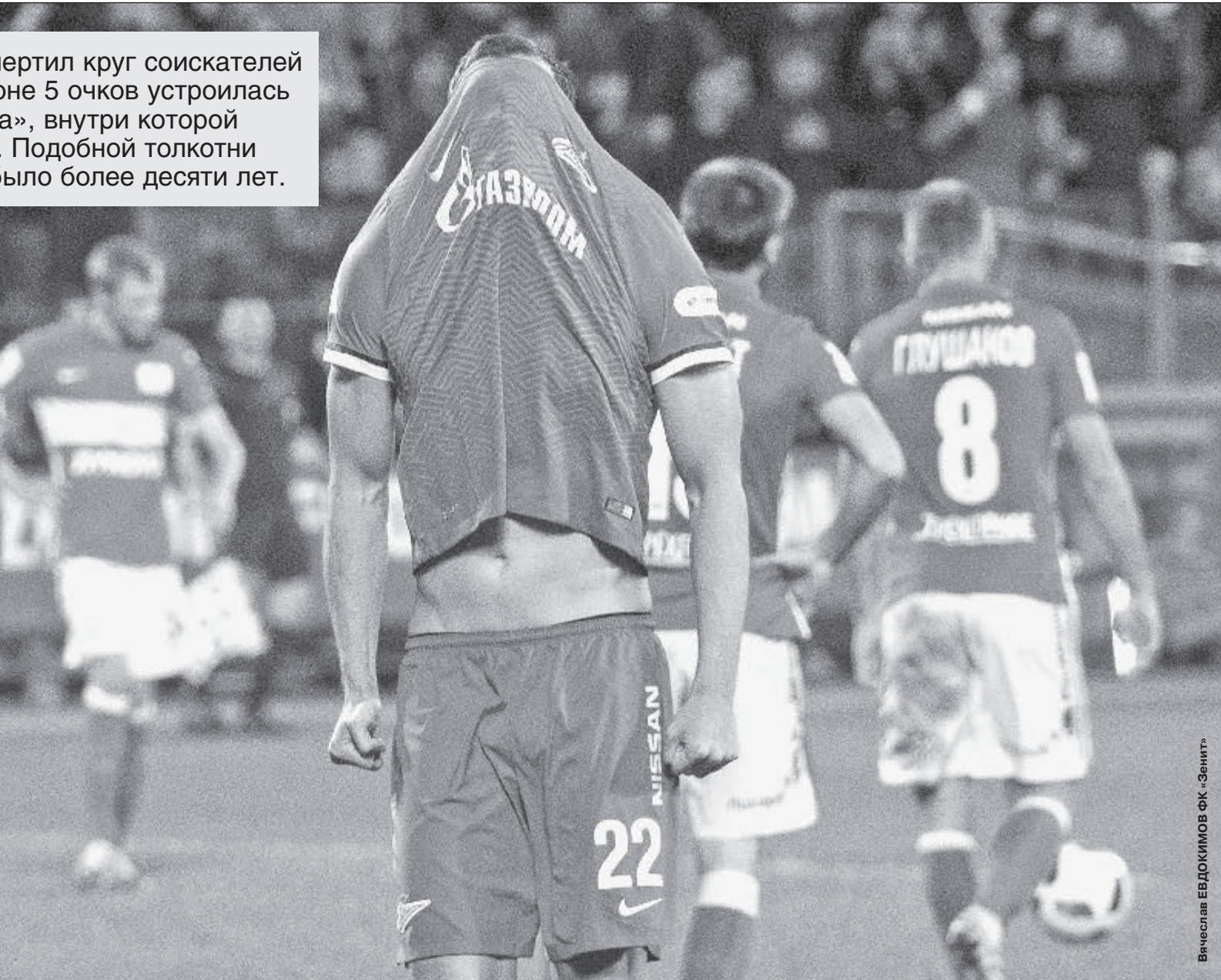
Суббота. Санкт-Петербург. «Зенит» - «Спартак» - 5:2. 65-я минута. Только что Артем ДЗЮБА (№ 22) забил победный гол в ворота своего бывшего клуба.