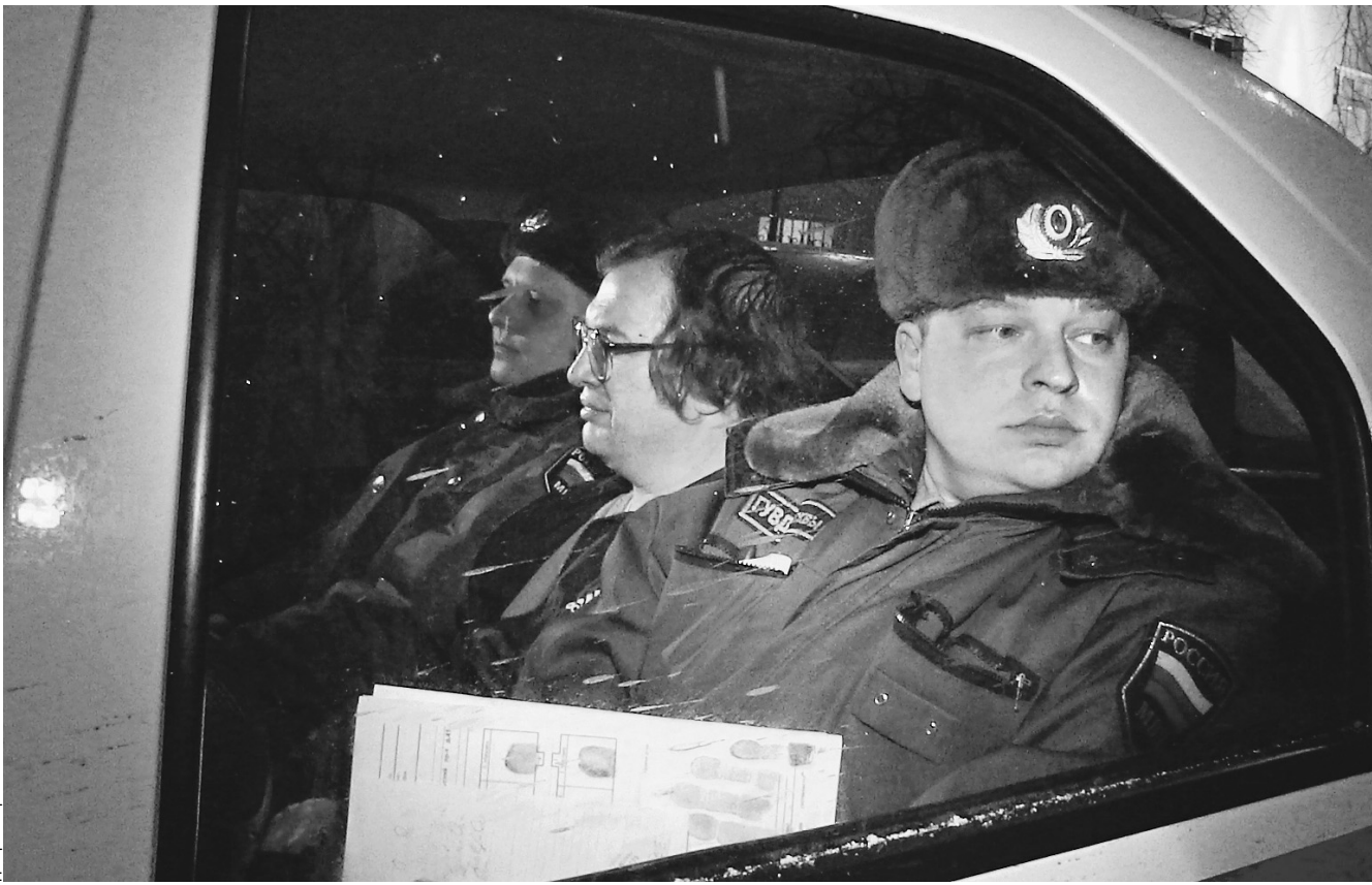
Для суда у Мавроди не хватает здоровья, а у его адвокатов — доверенности