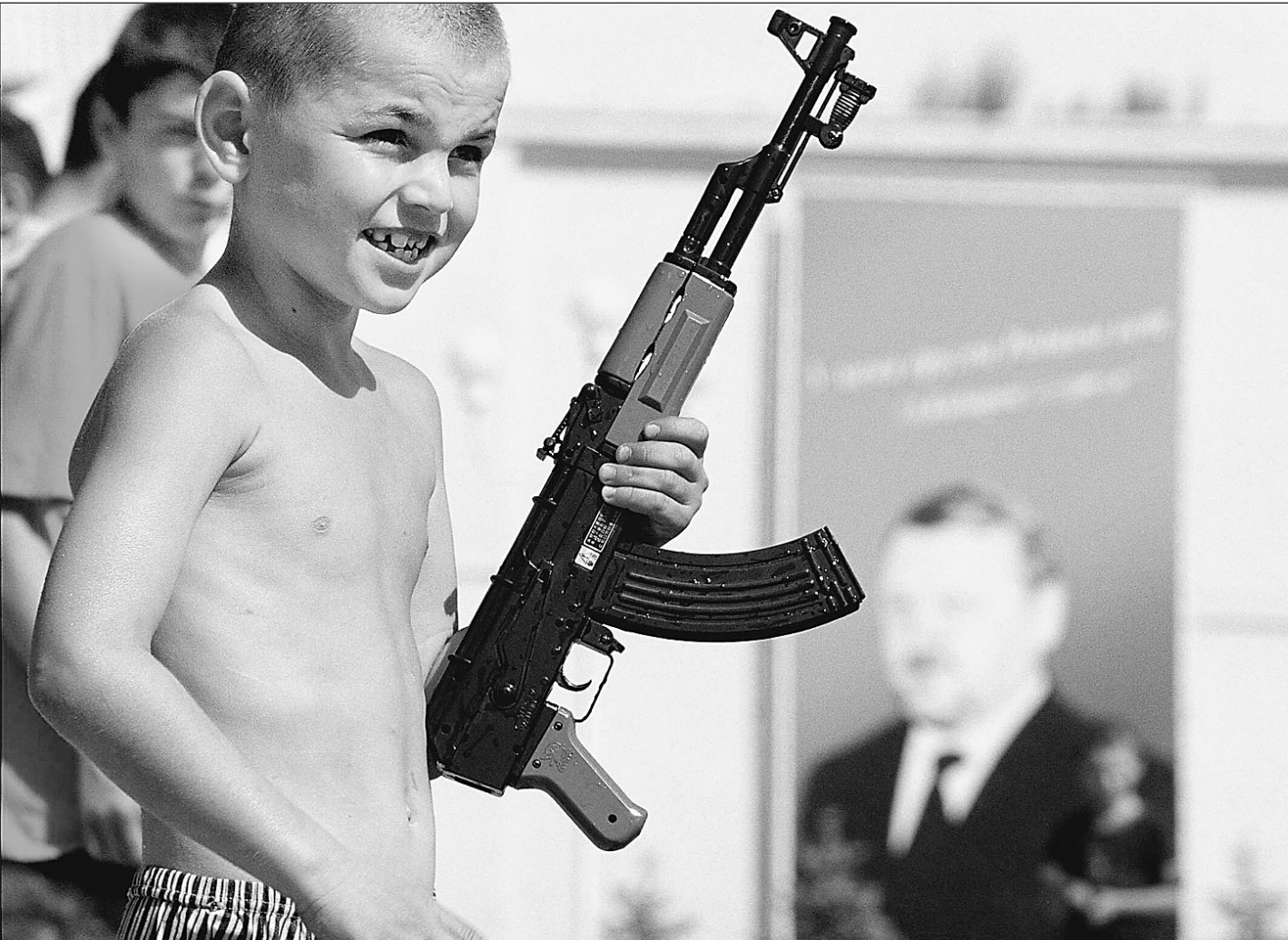
Главная игрушка чеченских детей начала XXI века