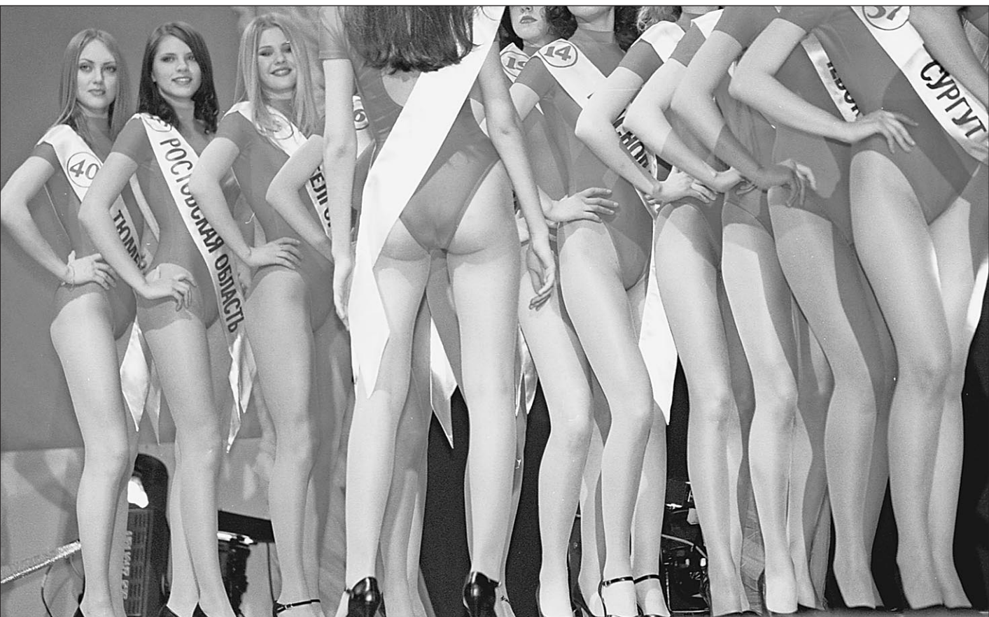
Были бы тарифы...