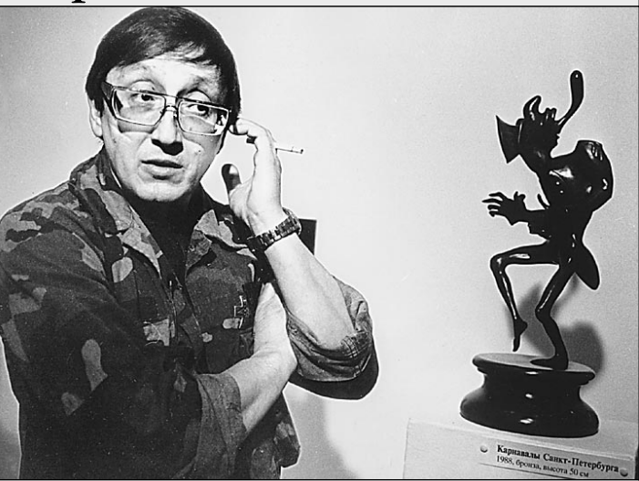
Вокруг работ Михаила Шемякина всегда происходит нечто странное