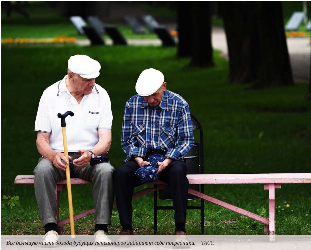
Все большую часть дохода будущих пенсионеров забирают себе посредники.

Банк России прогнозирует, что в 2017 году отток капитала из России составит около $19 млрд, а в 2018 году - $11 млрд.