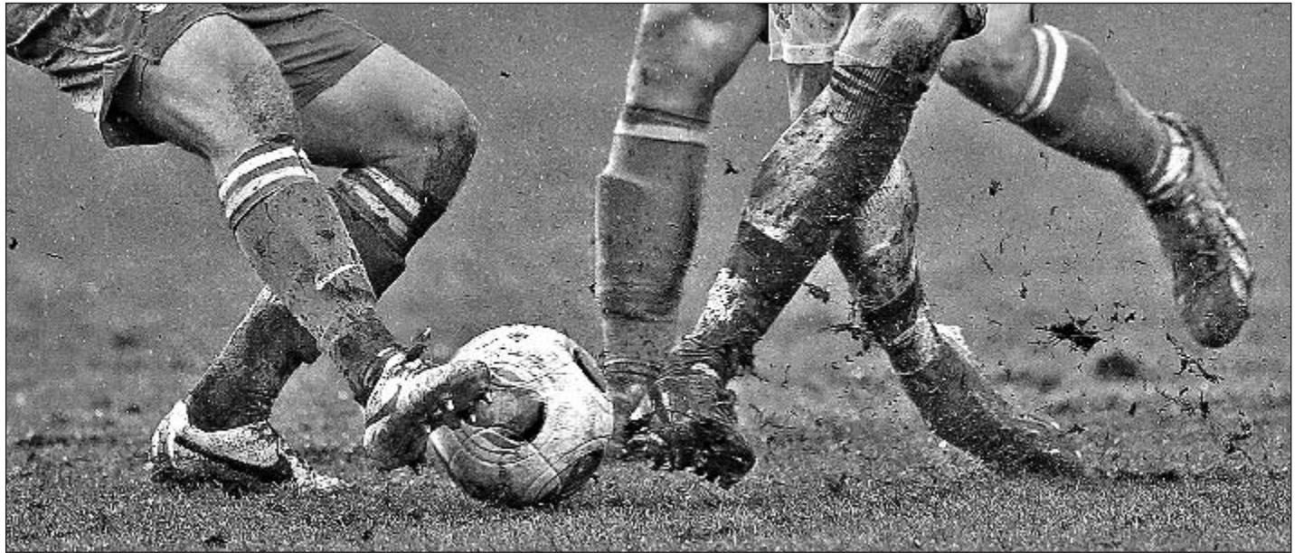
Пятница. Химки. Россия (мол) - Словения (мол) - 2:1. Дожди и бесчисленные матчи превратили штрафную площадь на «Арене Химки» в болотную.

Если бы молодежная сборная играла не 6-го числа, а, допустим, 8-го, то, наверное, поле «просохло» бы. Химкам элементарно не повезло, - констатирует Ефремов. - Но не забывайте, какое количество осадков выпало за три дня! В принципе до матча молодежии