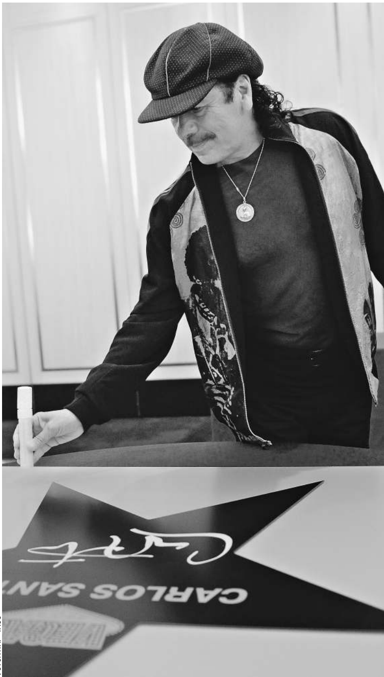
Карлос Сантана поставил автограф на своей персональной московской звезде

Накануне своего сольного концерта в Москве великий гитарист, американский мексиканец Карлос Сантана пообщался с журналистами в отеле «Ритц-Карлтон» и вспомнил Вудсток →10