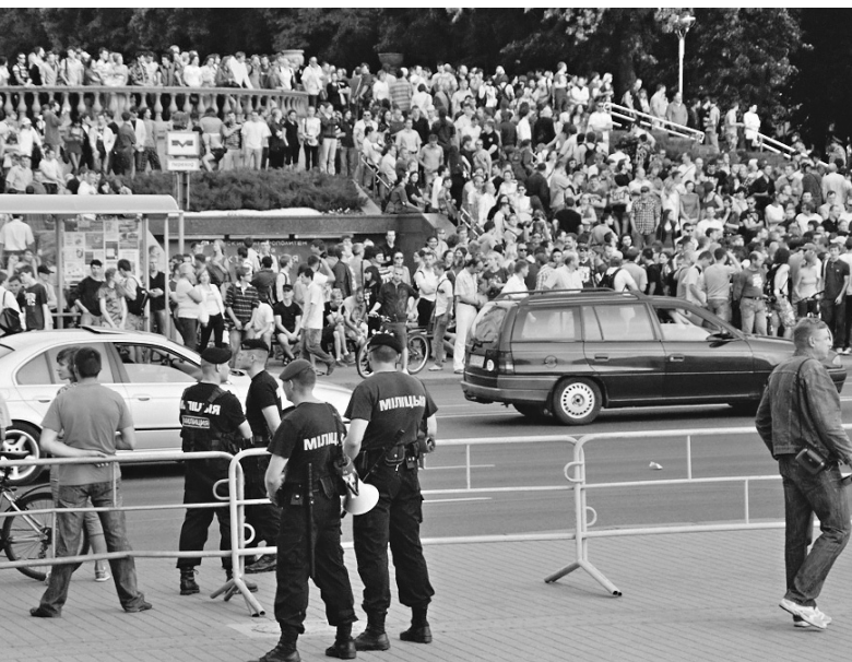
Милиционеры выполняют приказ властей, но смотрят на демонстрантов с сочувствием