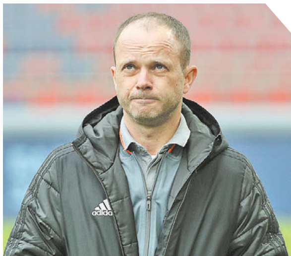
Александр Федоров «СЗ» / Canon EOS-1DX Mark II