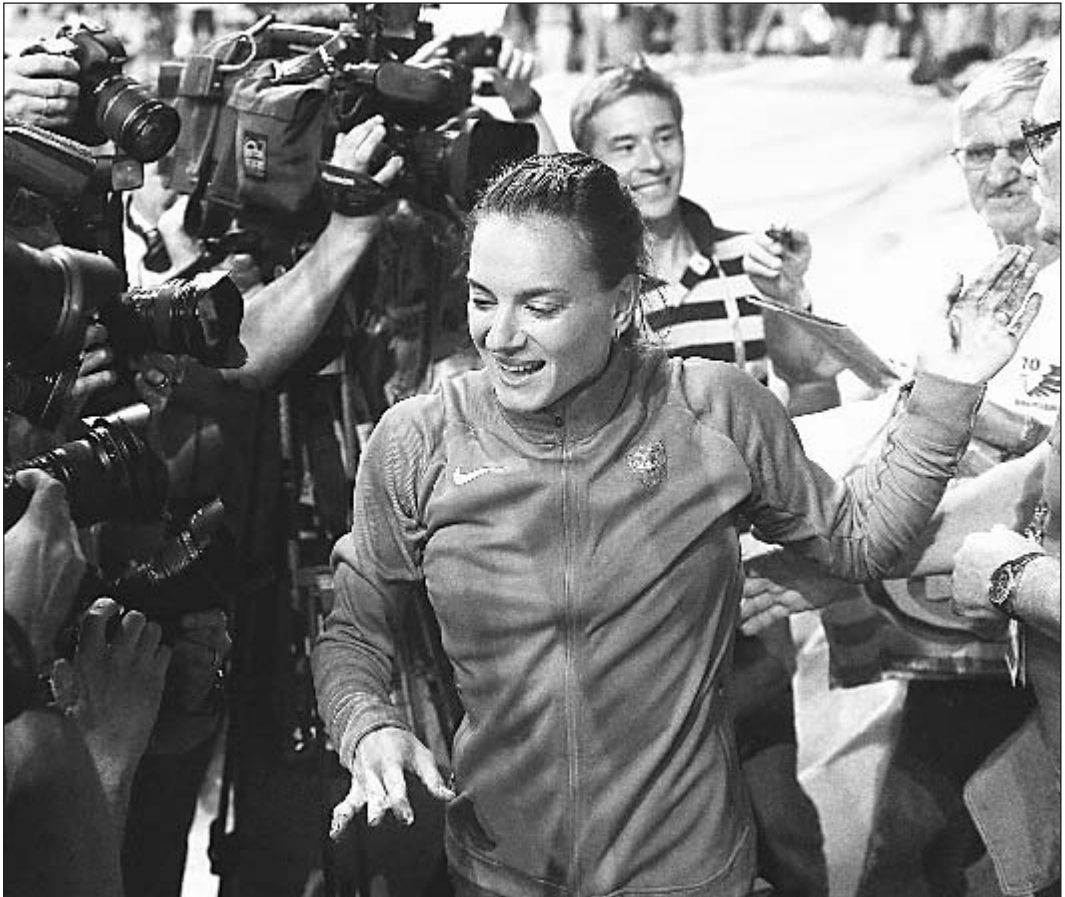
Вторник. Москва. Лужники. Елена ИСИНБАЕВА в центре всеобщего внимания.

Вчера интервью «СЭ» дала героиня московского чемпионата, под занавес карьеры вернувшая себе титул чемпионки мира